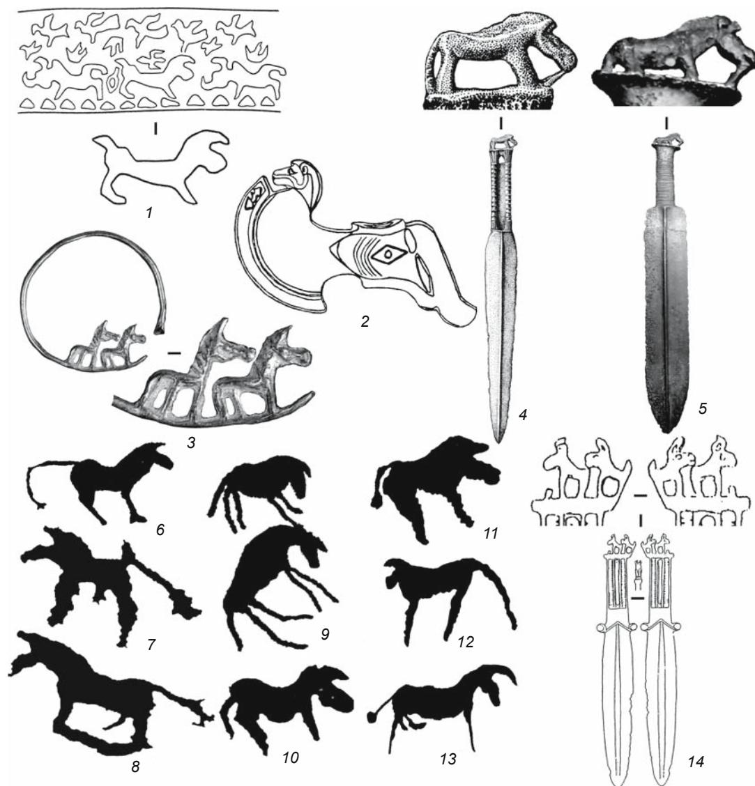
Рис. 2. Изображения коня на изделиях и петроглифах эпохи бронзы.

1 – Маргиана [Сарианиди, 1986, с. 43, рис. 14]; 2 – Бактрия [Кузьмина, 1994, с. 264]; 3 – Мыншункур [Ковтун, 2008, с. 96, рис. 1, 1]; 4 – с. Чарышское [Кирюшин, Шульга, Грушин, 2006, с. 51, рис. 1, 2]; 5 – г. Шемонаиха; 6 – Байконур Б [Новожинов, 2002, с. 69, табл. 2, 5.1]; 7 – Сагыр I [Самашев, 1992, с. 21, рис. 11]; 8, 10 – Мойнак [Там же, с. 40, рис. 46; с. 44, 45, рис. 51, 52]; 9 – Читыхисский чаатас [Миклашевич, 2007, с. 54, рис. 2, 6]; 11 – Саймалы-Таш [Миклашевич, 2010, с. 137, табл. I, 7]; 12 – Цагаан-Салаа I [Кубарев, Цэвээндорж, Якобсон, 2005, с. 169, рис. 89]; 13 – Цагаан-Гол [Jacobson-Tepfer, Kubarev, Tseveendorj, 2007, p. 103, fig. 1]; 14 – юго-запад Тувы [Чугунов, 1997, рис. 13].