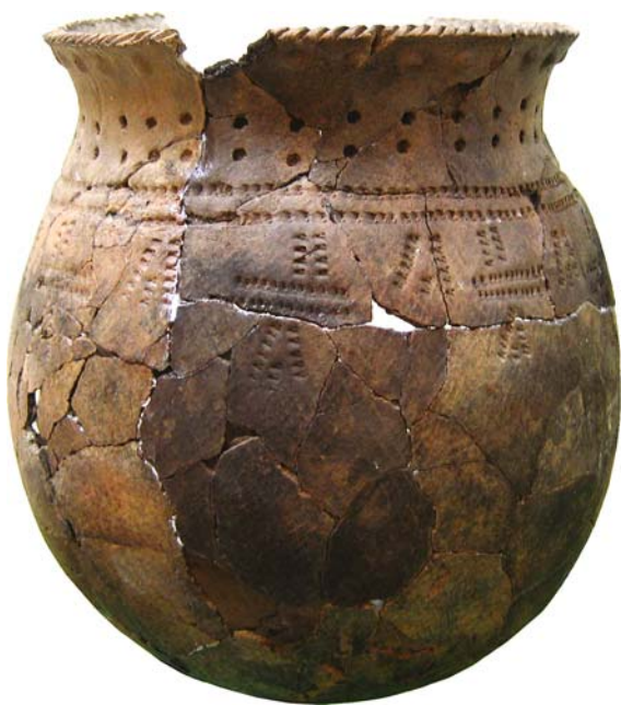
Рис. 3. Сосуд из культурного горизонта VII стоянки Улахан-Сегеленнях, украшенный стилизованными антропоморфными фигурами.

В бассейне Алдана посуда, украшенная «жемчужинами», встречена на стоянках Усть-Чуга II, Сумнагин II, Угино I, Тангха I (р. Амга). В четких стратиграфических условиях улахан-сегеленняхская керамика выявлена в культурном слое II стоянки Усть-Чуга II [Воробьев, 2007] (см. рис. 1, 5). Здесь обнаружены фрагменты по крайней мере семи сосудов. Три из них украшены выдавленными изнутри «жемчужинами». Первый представлен восемью фрагментами венчика и привенчиковой части (см. рис. 2, 3, 4). Это тонкостенный сосуд, декорированный по меньшей мере тремя горизонтальными поясами из вертикальных оттисков шестизубчатого штампа, двумя продавленными поверх первого пояса линиями (след технологической обмотки?) и одним рядом «жемчужин» под ним. Вертикальные оттиски того же штампа нанесены и на внутреннюю поверхность венчиков [Там же, с. 23–24, 107, 109, табл. 28, 7, 10; 30, 2, 4]. Второй сосуд выделяется по фрагменту венчика (см. рис. 2, 2). Он орнаментирован как минимум двумя поясами из вертикальных оттисков семизубчатого штампа, соединенными «перемычкой» из шести прямоугольных вдавлений зубчатого штампа (три в ширину, два в высоту), и одним рядом «жемчужин» в зоне верхнего пояса [Там же, с. 24–25, 107, 109, табл. 28, 11; 30, 3]. Третий сосуд определен по 35 фрагментам вафельной керамики (см. рис. 2, 13). Он украшен тремя поясами из вертикальных оттисков семизубчатого штампа, небрежно продавленной (аналогично первому сосуду) поверх первого линией и одним рядом «жемчужин» в