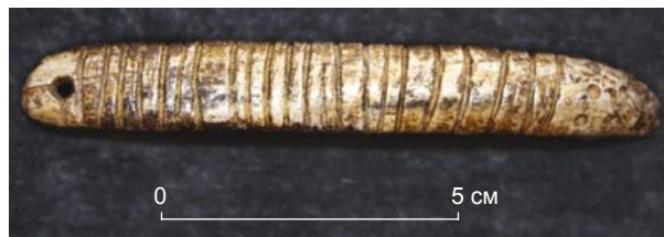
Рис. 1. «Орнаментированный» стержень со стоянки Мальта.

Интересно проследить разные контексты и способы использования одного материала – терракоты. Во Французских Пиренеях применялись различные технологии изготовления художественных предметов из глины – моделирование, скульптура, гравировка. В Моравии зафиксирована преимущественно скульптура, антропоморфная и зооморфная, выполненная по определенному канону, причем отпечатки пальцев на материале говорят о том, что эти изделия делали женщины и дети. Следовательно, можно отметить вариативность использования глины: индивидуальный поход к созданию художественных предметов во