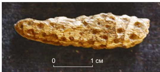
Рис. 3. Фрагмент скульптурной поделки из бивня мамонта со стоянки Мальта.

Известно, что в традиционных культурах нюансы в передаче того или иного образа играют определяющую роль. По свидетельству С.В. Иванова, у народов Амура при болях в животе изготавливалась фигурка медведицы с небольшим вздутием в брюшной части. При общем недомогании гольды делали из дере-