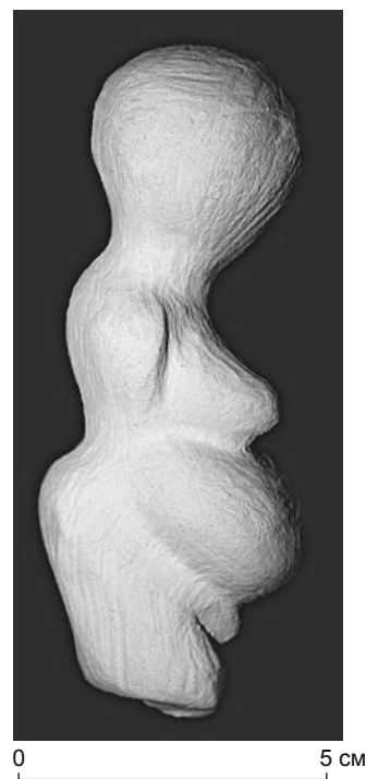
Рис. 2. Экспериментально изготовленная из мела фигурка женщины костяночного типа (автор Ю.С. Волкова).

Французских Пиренеях и более стандартизированные действия с данным материалом в Моравии [Bougeaux, 2004; Bougard, 2010].