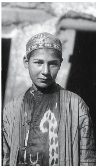
Рис. 4. Юноша в камзоле без воротника, сшитом из кустарного атласа с абрвовым узором; поверх надет халат туникообразного покроя джома . Бухарский еврей. Самарканд. 1900–1902 гг. ФК РЭМ, 49, 23.