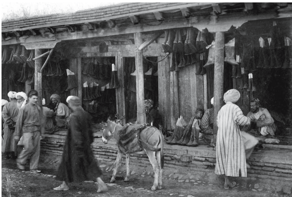
Рис. 8. Торговые ряды на базаре в Самарканде. На переднем плане слева – бухарский еврей в темном камзоле. 1900–1902. Фото С.М. Дудина. ФК РЭМ, 48, 204.

фом и собирателем этнографических коллекций по Средней Азии, среди горожан по черному длинному камзолу безошибочно можно определить фигуру бухарского еврея (ФК РЭМ, 42, 26, 100; 46, 7; 48, 197,