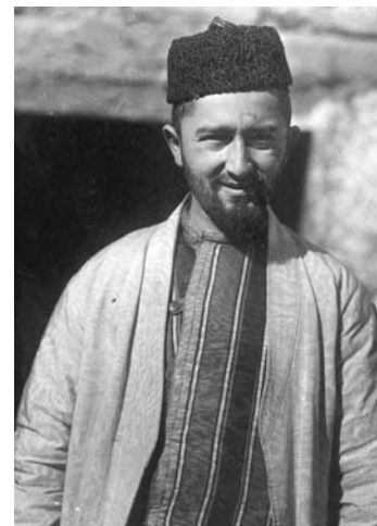
Рис. 3. Мужчина в камзоле без воротника и с правосторонним запахом, сшитом из кустарного полшелка бекасаб ; поверх надет халат туникообразного покроя джома . Бухарский еврей. Самарканд. 1900–1902 гг. Фото С.М. Дудина. ФК РЭМ, 49, 18.