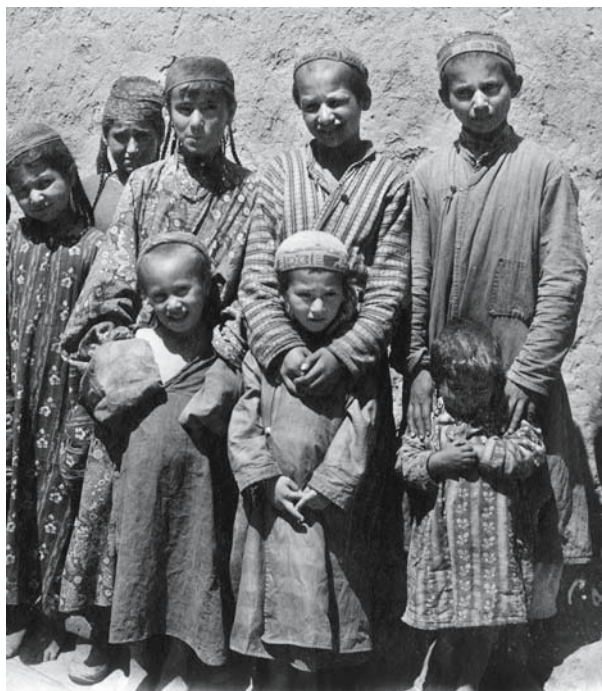
Рис. 7. Мальчики разных возрастов в камзолах с воротником-стойкой из фабричных тканей. Бухарские евреи. Самарканд. 1900–1902 гг. ФК РЭМ 49, 10.

В мужском костюме бухарских евреев камзол имел широкое распространение уже в последние десятилетия XIX в. На большинстве известных фотографий, снятых начиная с 1880-х гг. в Бухаре, Самарканде, Ташкенте, Коканде, в камзолах запечатлены и мальчики, и юноши, и мужчины (ФК РЭМ, 49, 7, 8, 12–15, 17, 18, 21, 23, 25, 30; 94, 25; 5378, 1; 5465, 1; 8856, 26; АПИИ. Ф. 12. Оп. 3. Д. 14. Л. 10, 92, 94, 116, 131). На снимках, сделанных в 1900–1902 гг. в Самарканде и других городах С.М. Дудиным – известным фотогра-