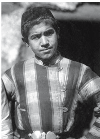
Рис. 2. Юноша в камзоле с воротником-стойкой и левосторонним запахом из фабричного полшелкового полосатого атласа, надетом в качестве верхней одежды. Бухарский еврей. Самарканд. 1900–1902 гг. Фото С.М. Дудина. ФК РЭМ, 49, 17.

Направлению запаха камзолов бухарские евреи, вероятно, значения не придавали: одежда персонажей на известных фотографиях запахивается то слева направо, то справа налево (см. рис. 4). Если у кочевых народов региона (казахов, киргизов) одежда, согласно древнетюркской традиции, имела преимущественно правосторонний запах [Антипина, 1962, с. 223; Захарова, Ходжаева, 1964, с. 40, 53], то у оседлых она не всегда соответствовала этому обычаю [Рассудова, 1970, с. 25]. Однако камзолы в Средней Азии не только у тюркоязычных народов, но и у таджиков запахивались только слева направо, о чем свидетельствуют описания исследователей [Льюшкевич, 1978, с. 125; Рас-