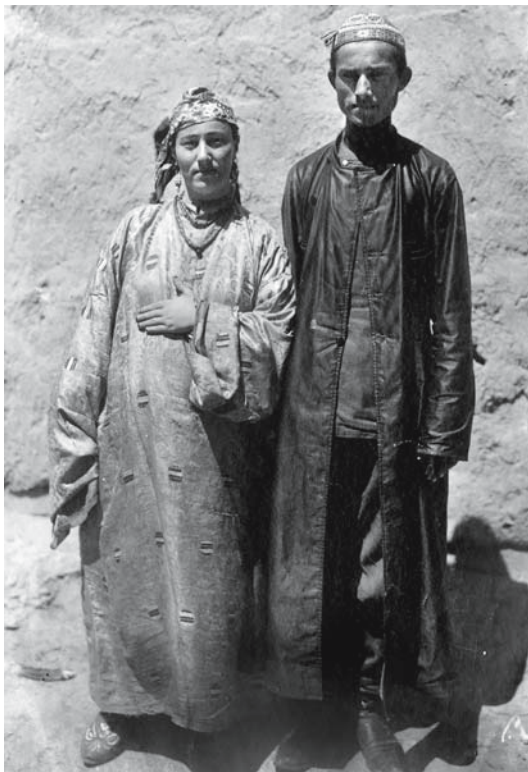
Рис. 6. Мужчина в камзоле из черного сатина с воротником-стойкой и правосторонним запахом, надетом в качестве верхней одежды. Бухарские евреи. Самарканд. 1900–1902 гг. Фото С.М. Дудина. ФК РЭМ, 49, 8.

По силуэту камзолы бухарских евреев выделялись некоторыми особенностями. Можно отметить почти прямые камзолы (ФК РЭМ, 49, 8), слегка приталенные и расширенные книзу, как у соседних народов (ФК РЭМ, 5465, 1), зауженные до талии и сильно расклешенные книзу за счет боковых клиньев. Например, в зауженных камзолах предстают ученики на фотографии 1871 г. Туркестанского альбома, подготовленного к Всероссийской Политехнической выставке 1872 г. в Москве (ныне 1 экз. альбома хранится в Фотофонде Библиотеки Конгресса США) [Turkestan Album..., LC-DIG-ppmsca-09951-00245]. Такие же камзолы можно увидеть на персонажах, запечатленных в еврейском квартале Самарканда в 1907 г. известным фотографом С.М. Прокудиным-Горским [Ibid., LC-DIG-ppmsc-04442].