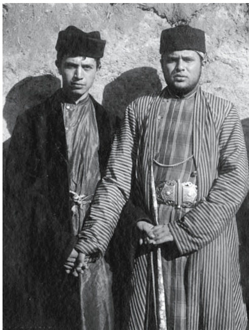
Рис. 1. Мужчины в камзолах с воротником-стойкой и правосторонним запахом, опоясаны платком и поясом с пряжкой; в качестве верхней одежды туникообразного покроя – халаты яхтак (справа) и чекман из темной шерстяной ткани (слева). Бухарские евреи. Самарканд. 1900–1902 гг. Фото С.М. Дудина. ФК РЭМ, 49, 14.

ские камзолы здесь всегда шили со стоячим воротником [Сухарева, 1982, с. 55–56].