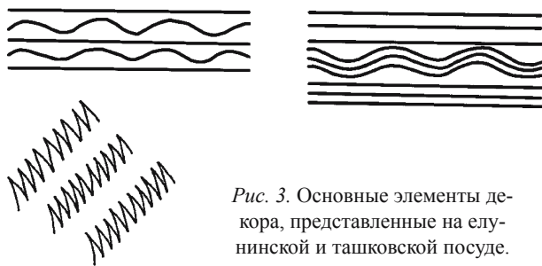
Рис. 3. Основные элементы декора, представленные на елунинской и ташковской посуде.

с. 50–51]. Сказанное позволяет говорить о контактах ташковских и алакульских коллективов только на протяжении «кулевчинской» фазы и «чистолебяжского» этапа алакульской культуры.