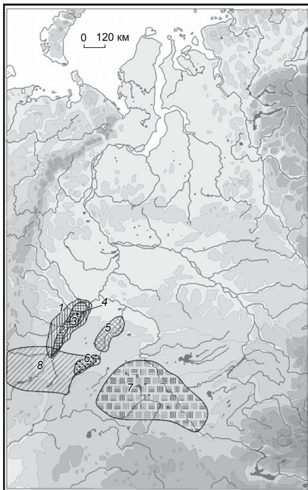
Рис. 1. Карта-схема ареалов культур энеолита – начального этапа бронзового века Западной Сибири.

1 – байрыкско-лыбаевская культура; 2 – ташковская культура; 3 – памятники имбиряйского типа; 4 – место расположения поселения Мостовое-1; 5 – одиновская, лоиновская культуры Приишимья; 6 – памятники вишневого типа; 7 – ареал елунинской культуры (по Ю.Ф. Кирюшину); 8 – ареал синташтинско-петровских древностей.