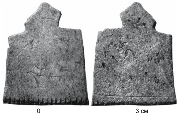
Рис. 1. Роговой амулет с Рождественского городища.

Композиция вызывает значительный интерес в плане развития наших представлений о содержании мифов, главным персонажем которых является Всадник. Его изображения зафиксированы на широком круге разнообразных предметов, распространившихся в эпоху средневековья по обе стороны Урала. Первые, с кем вызывает ассоциации всадник на рассматриваемом рисунке, это «сокольничьи» – изображения всадников