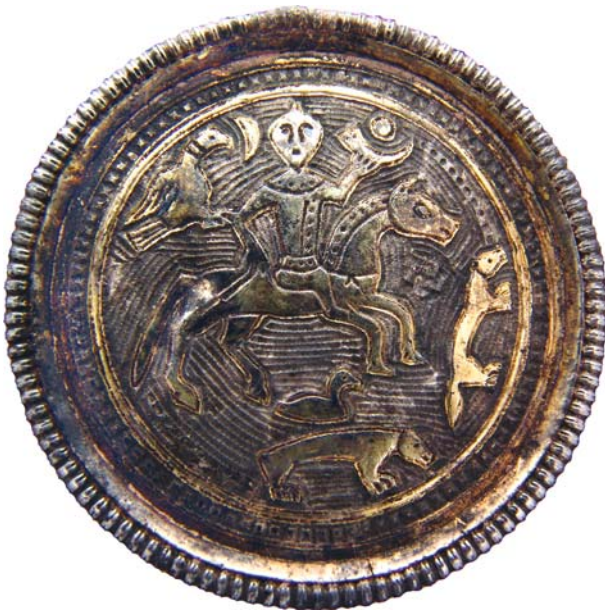
Рис. 3. Бляха с «сокольничим». Пермский край, браконьерские сборы 2002 г.