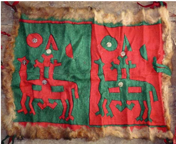
Рис. 4. Жертвенное покрывало сынских хантов с изображением всадников (по: [Сынские ханты, 2005, с. 223]).

представлено в этнографических материалах на жертвенных покрывалах ялтынг-улама обских угров (рис. 4) [Гемуев, Бауло, 2001; Сынские ханты, 2005].