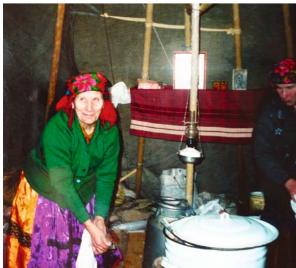
Рис. 5. Иконы в чуме коми-ижемцев, 1990-е гг.

Для того, чтобы в доме был достаток, в икону (в деревянной рамке со стеклом) клали бумажные и медные деньги (рис. 6). Иконы выносили из дома, когда требовалось остановить огонь. М.К. Завьялова рассказала о таком происшествии: «На берегу все балки горели – с иконой стояла Казанской (Казанская икона Божьей Матери), молитву читала: “Казанский Божьей Матерь, помоги пожар тушить! От души прошу тебя,