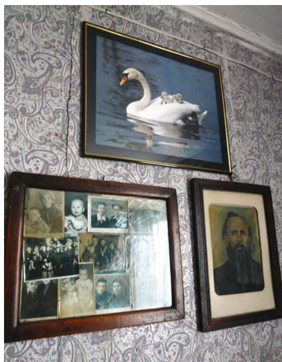
Рис. 3. Изображение лебедя как оберег в доме коми-ижемцев, д. Новый Киеват Шурышкарского р-на, 2010 г.

Самыми любимыми у ижемцев были иконы с изображением Божией Матери, Иисуса Христа и Николая Чудотворца. Это наиболее чтимые в Западной Сибири, в частности на Тюменском Севере, христианские персонажи [Иерей Андрей (Тимошенко)]. Встречались и другие образы (говорим только о «старых» иконах, приобретенных до конца XX в.), например, Пантелеймона Целителя, святителя митрополита Тобольского Иоанна, архангела Михаила, Серафима Са-