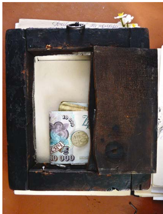
Рис. 6. Икона-оберег, умножающая богатство в доме, с. Полноват Белоярского р-на, 2010 г.

помоги, ради Христа!” И помог, потухло». С помощью иконы искали утопленника: ее пускали на воду, и она, крутясь, должна была показать то место, где произошло несчастье.