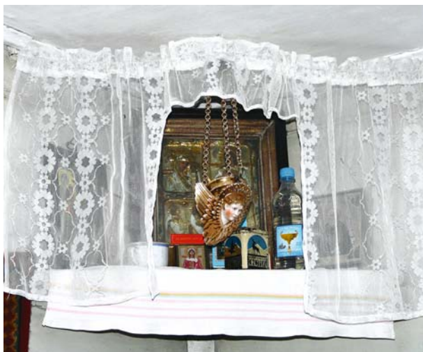
Рис. 1. Божница в доме коми-ижемцев, д. Новый Киеват Шурышкарского р-на, 2010 г.