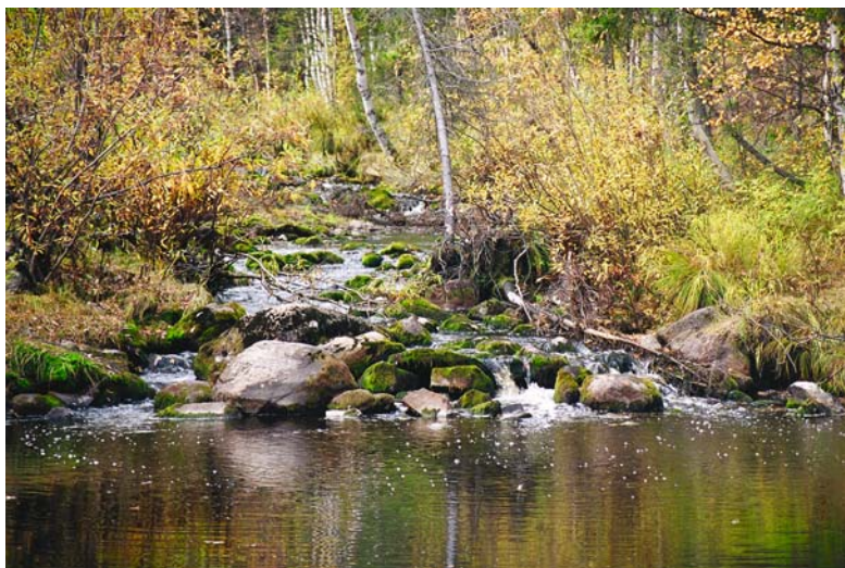
Рис. 9. Бурэдан на р. Юган близ с. Мужа Шурышкарского р-на, 2008 г.

Культурный ландшафт селений, где проживали ижемцы, а также близлежащих территорий включал в себя не только кресты, но и почитаемые водные объекты. Недалеко от с. Мужа вверх по р. Юган находится пережат, где река поворачивает направо и ее движение преграждают валуны ( бурэдан или бурудан ; по одной из версий, это слово заимствовано у хантов, у которых есть созвучное сочетание двух слов, оно переводится как «говорящая вода»). Вода здесь прозрачная, чистая, ее считали целебной (рис. 9). По воспоминаниям информаторов, накануне дня Ивана Купала ею обливались, ее пили, набирали для бытовых и лечебных целей. На Крещение здесь накалывали лед (иордань не делали, поскольку неглубокая река промерзала практически до самого дна). Эту воду хранили целый год, она не портилась. Ею, по словам А.Ф. Хозяиновой, полоскали горло, промывали гноящиеся глаза. Бурэдана просили об исцелении [Шарапов, 2006, с. 21–22]. Сейчас на Крещение святую воду ( вежа ва ) набирают из иордани на р. Малая Обь. Перед тем, как на Крещение идти за новой водой, оставшейся брызгали по углам дома, чтобы «ушло плохое». При этом произносили примерно такие слова: «Чтобы хорошо все было, не болели да здоровы были». Раньше ввиду отсутствия священников воду освящали верующие пожилые люди, как правило, женщины. Благоговейное отношение к крещенской воде сказывалось, например, в том, что некоторые хранили ее на божнице, рядом с иконами. Теперь освященную воду можно взять в церкви, однако лечиться предпочитают именно кре-