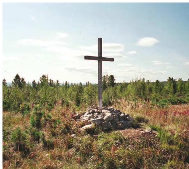
Рис. 8. Урочище Кресты близ с. Мужы Шурышкарского р-на, 2005 г.