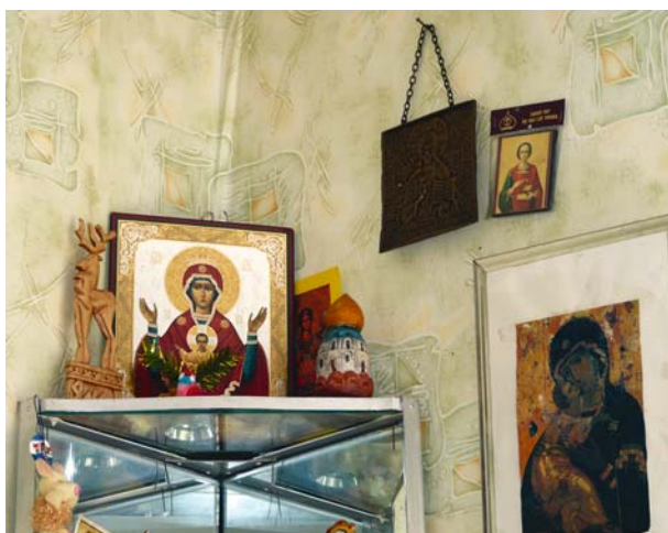
Рис. 2. Красный угол в доме коми-ижемцев, с. Мужы Шурышкарского р-на, 2009 г.

(или тех персонажей, которых принимают за ангелочков). В одном доме на божнице рядом с иконами мы видели фигурку эльфа, пасхальные яйца, емкость со святой водой, лампадное масло, свечи, ладан, просфоры, веточки ольхи или вербы. На полки, где находятся иконы, ставят различные фигурки. Например, в одном из домов рядом с иконами стояли деревянная фигурка оленя с надписью на постаменте «Ямал», выполненная из дерева и раскрашенная акварелью миниатюрная церковь, лежали раковины моллюсков и др. (рис. 2).