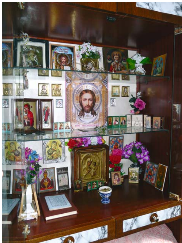
Рис. 4. Шкаф-киот в доме коми-ижемцев, с. Полноват Белоярского р-на, 2010 г.

ровского, Стефана Пермского, великомученика Харлампия, святой мученицы Стефаниды и др. На одной из икон, четырехфигурной по композиции, изображены Св. Власий епископ Севастийский, Св. преподобный Лазарь, Св. преподобный Ануфрий Афонский, Св. мученик Харлампий. Иконы в основном одно- и двухфигурные. Одни из них были привезены ижемцами из-за Урала, а другие, видимо, приобретены уже в Сибири.