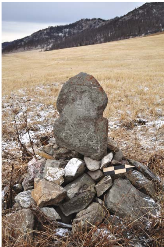
Рис. 2. Место обнаружения изваяния. Общий вид.