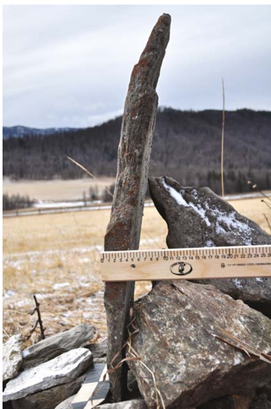
Рис. 4. Изваяние в урочище Айлян. Вид с левой стороны.

на изваянии, возможно, были позднее подновлены. Нижняя часть фигуры обломана, поэтому невозможно определить, имелись ли на ее лицевой стороне еще какие-либо изображения. Можно предположить, что у фигуры, как и у многих других каменных изваяний древнетюркской культуры, были выделены руки, держащие на животе сосуд.