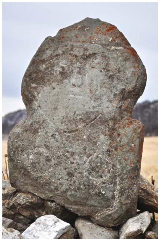
Рис. 3. Изваяние в урочище Айлян. Вид спереди.