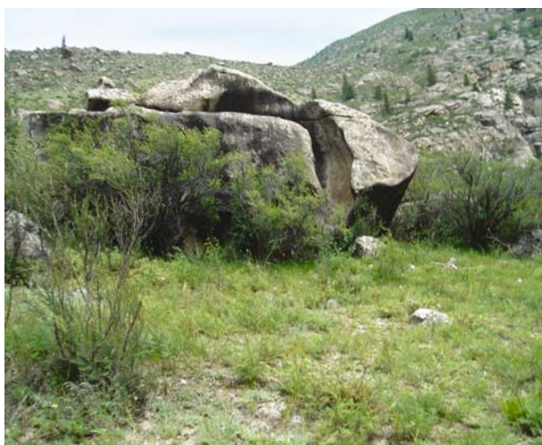
Рис. 2. Монолит с желобом и рисунками.