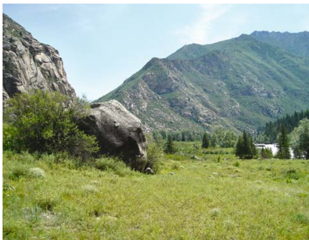
Рис. 1. Камень-голова.