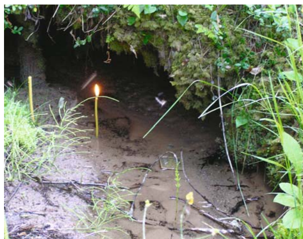
Рис. 7. Икона в источнике Егор ва, д. Муфтыога.