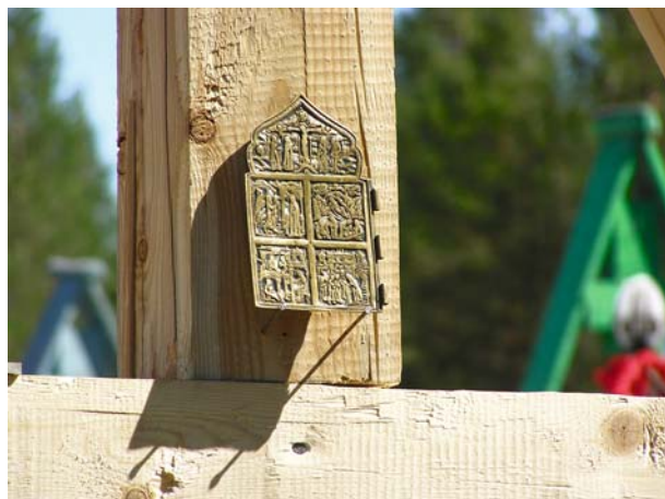
Рис. 4. Фрагмент намогильного креста во время погребения, д. Муфтыога, Удора. Фото В.В. Власовой, 2006 г.