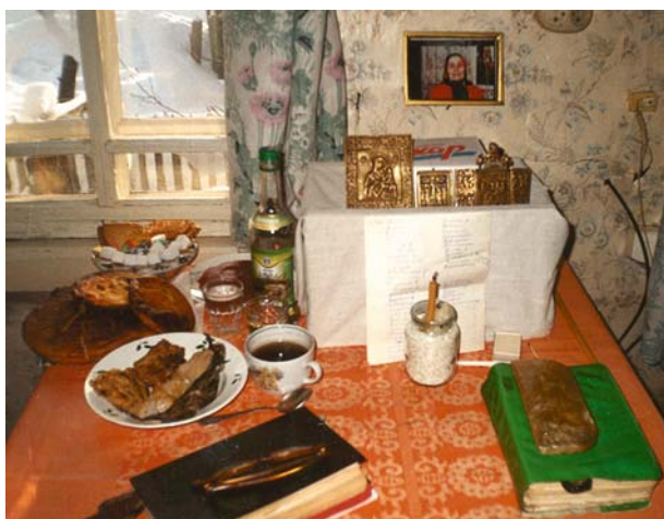
Рис. 6. «Алтарь» на поминках, с. Чупрово, Удора. Фото Л.Н. Муравьевой, 2002 г.