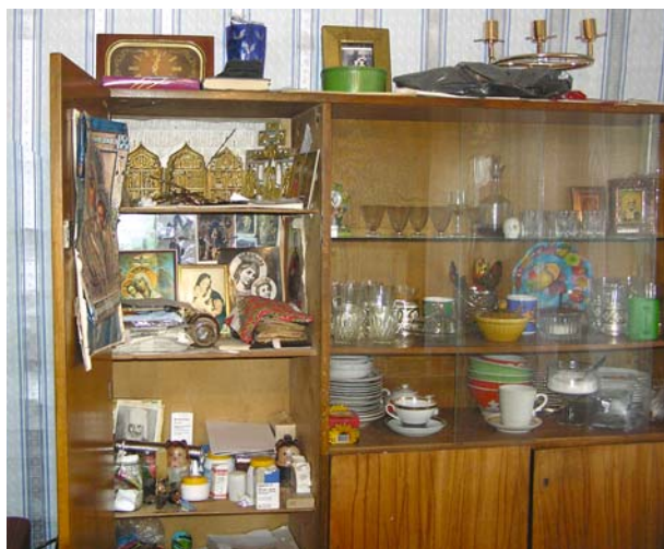
Рис. 2. Иконы в шкафу, с. Покча, верхняя Печора. Фото В.В. Власовой, 2007 г.