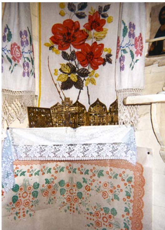
Рис. 1. Божница, с. Керчомья, верхняя Вычегда. Фото В.В. Власовой, 1999 г.

Обязательным предметом современного интерьера является божница ( енко, енчом ), расположенная в восточном углу дома. На верхней Вычегде ее украшают вышитыми полотенцами, часто иконы стоят за занавесками также с вышивкой (рис. 1). В старообрядческих домах на Печоре и Удоре подобная практика не встречается. У некоторых староверов иконы стоят не в божнице, а в шкафу (рис. 2), за ним или в другом