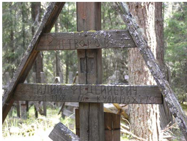
Рис. 5. Намогильный крест с выемкой для иконы, с. Покча, верхняя Печора. Фото В.В. Власовой, 2007 г.