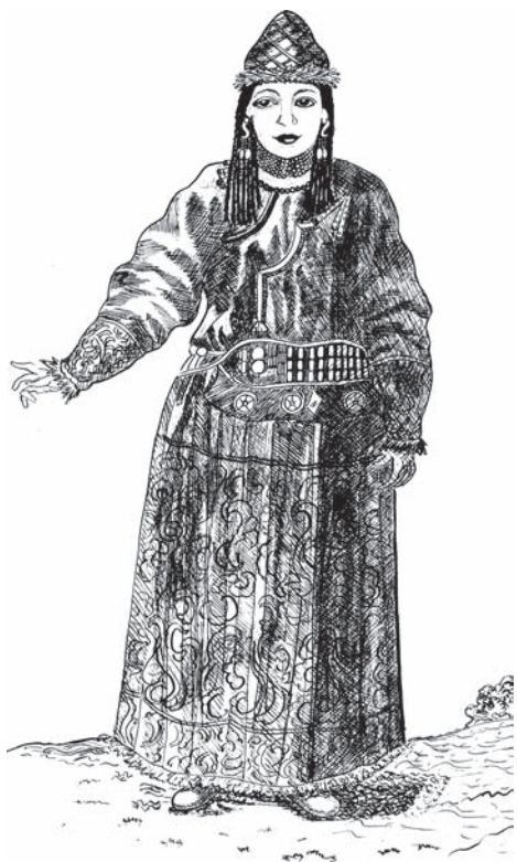
Рис. 2. «Брацкая девушка в Удинском остроге...» [Георги, 1799, с. 33].

Бранд, 1967, с. 134]. Чтобы разобраться в возникшей путанице, нужно рассмотреть, как обстояло дело с этим элементом одежды в последующее время – в XVIII в.