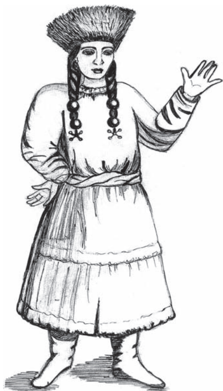
Рис. 1. Бурятка [Идес, Бранд, 1967, с. 133].