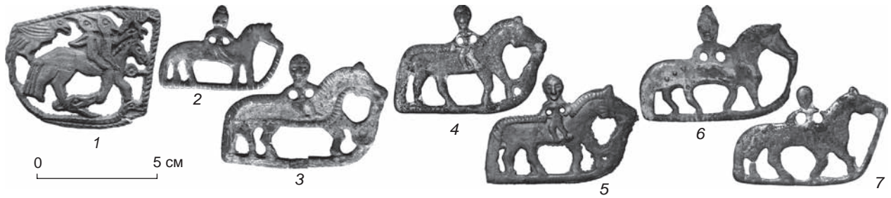
Рис. 4. Культовая плакетка из браконьерских сборов в Пермском крае (1) и подвески-всадники из Баяновского могильника (2–7).

2 – погр. 29; 3 – погр. 37; 4 – погр. 58; 5 – погр. 59; 6 – погр. 107; 7 – погр. 128.