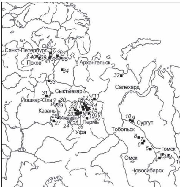
Рис. 1. Схема распространения предметов с изображением сюжета «животное/всадник на основании».

Основание. Это главное, что объединяет предметы рассматриваемой серии. Некоторые основания на од-