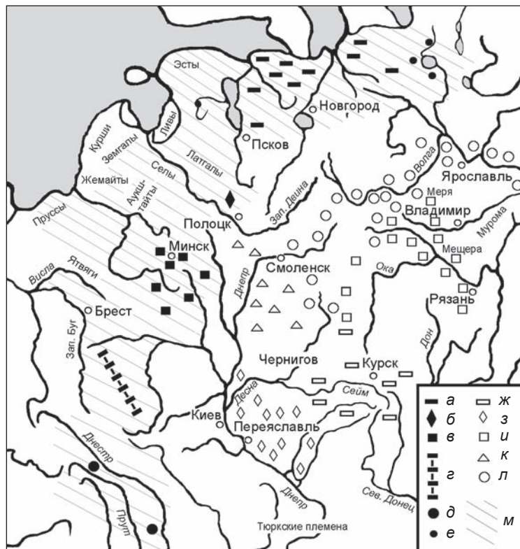
Рис. 3. Население Восточной Европы в X–XIII вв.

чья) проживало население более или менее сходного антропологического облика, объединяющего его с балтами I и II тыс. н.э. и ранними группами Эстонии (рис. 3). Обитатели центральных и восточных районов Руси обладали иным комплексом признаков, характеризующимся ослаблением европеоидных черт, который сближает их с поздними новгородцами, испытывавшими финское влияние. Как уже отмечалось