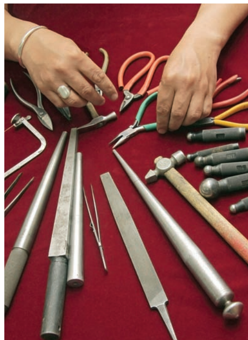
► 3. Инструменты зергера.