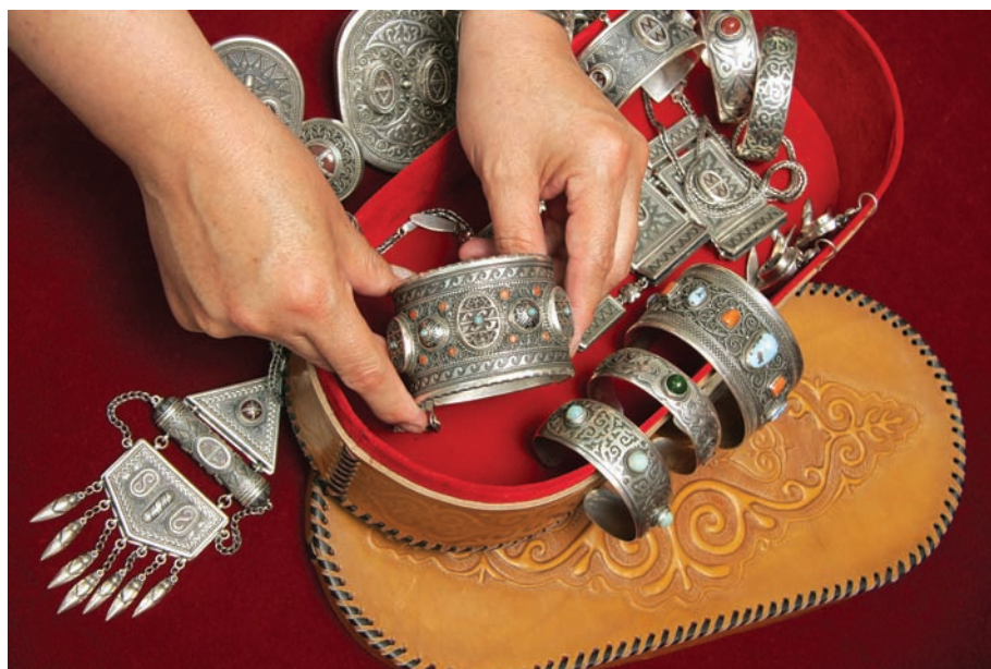
12. Шкатулка с набором традиционных казахских украшений.

У казахов есть пословица: «Бир айел болса да, зергер жумыссыз калмайды» – «Пока есть хоть одна женщина, ювелир не останется без дела». Украшения хорошего зергера, работающего под покровительством духов-предков, несут в себе заряд его силы и являются благопожеланием. Украшения придают законченность облику женщины, подчеркивают ее достоинство, спасают от болезней и бед. Любовь к украшениям, умение их носить и беречь – часть традиционной казахской культуры.