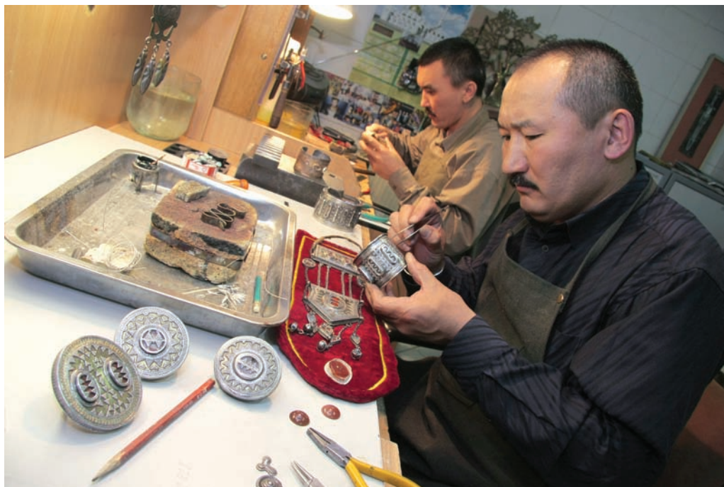
11. Реставрация традиционных украшений XIX в. из Западного Казахстана в Президентском центре культуры Республики Казахстан.

У казахов есть пословица: «Бир айел болса да, зергер жумыссыз калмайды» – «Пока есть хоть одна женщина, ювелир не останется без дела». Украшения хорошего зергера, работающего под покровительством духов-предков, несут в себе заряд его силы и являются благопожеланием. Украшения придают законченность облику женщины, подчеркивают ее достоинство, спасают от болезней и бед. Любовь к украшениям, умение их носить и беречь – часть традиционной казахской культуры.