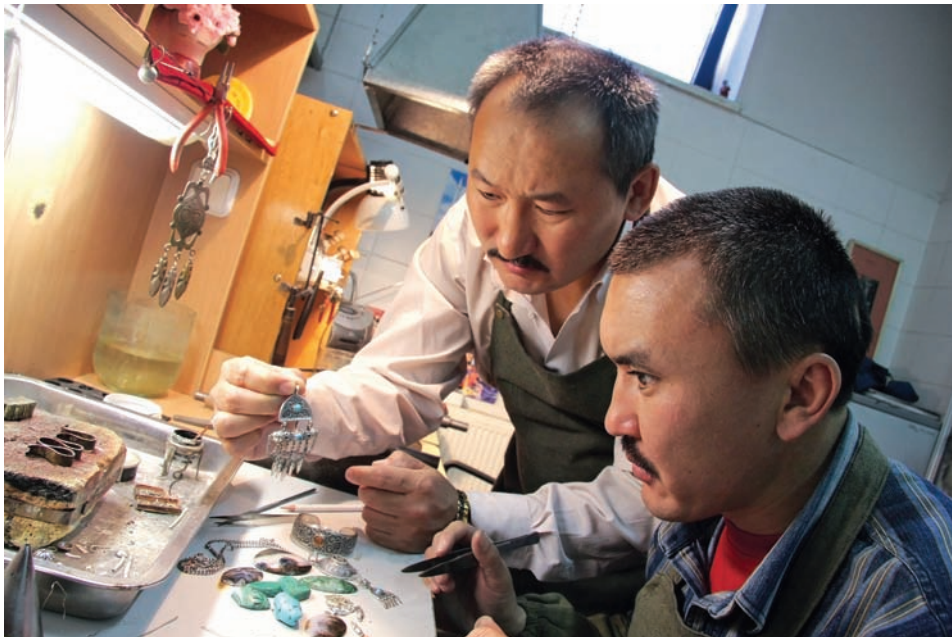
10. Подбор камней для женского нагрудного украшения бойтумар .

Традиционное ремесло казахских зергеров опиралось на знание фамильных секретов мастерства. Согласно старинным канонам, камни в украшениях должны быть закрыты. Их глубина и сияние превращались в тайну. Во власти зергера находились природа камня, блеск серебра и свет женских глаз. Оправляя в серебро женскую красоту, ювелир открывал ее тайну.