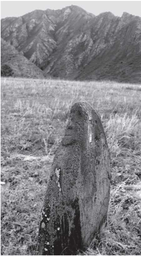
Рис. 1. Каменное изваяние «окуневского типа» в долине Ниж. Инегеня. Онгудайский р-н Республики Алтай.