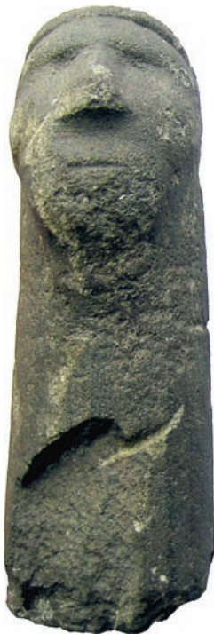
Рис. 8. Антропоморфные оленние камни, установленные в устье р. Цагаан-Гол. Сомон Цэнгэл Республики Монголия.