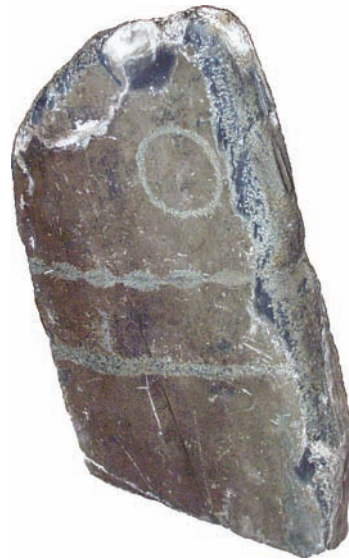
Рис. 6. Оленный камень с личиной «окуневского типа» из могильника Кызыл-Джар. Кош-Агачский р-н Республики Алтай.