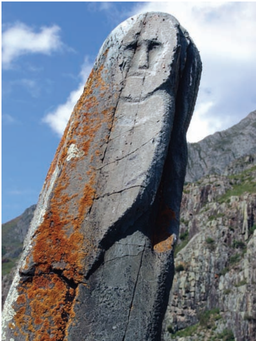
Рис. 5. Чуйский оленный камень с личиной «окуневского типа». Онгудайский р-н Республики Алтай.