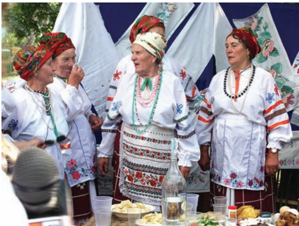
Рис. 13. Сибирские украинцы. 2006 г.