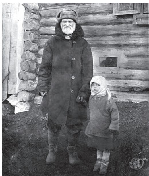
Рис. 4. Русский крестьянин-переселенец. Колосовский р-н Омской обл. Первая половина XX в. Фотоархив Музея археологии и этнографии Омского государственного университета.

Фотоархив Исилькульского районного историко-краеведческого музея (Омская обл.). Фотокопия с оригинала Г.Е. Катанова, хранящегося в Омском государственном историко-краеведческом музее.