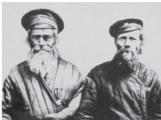
Рис. 3. Южно-сибирские казаки. Акмолинская область. Конец XIX в.

В соответствии с итогами Первой всеобщей переписи населения Российской империи 1897 г. русских