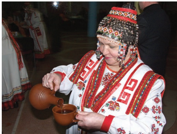
Рис. 15. На чувашском празднике. 2006 г.