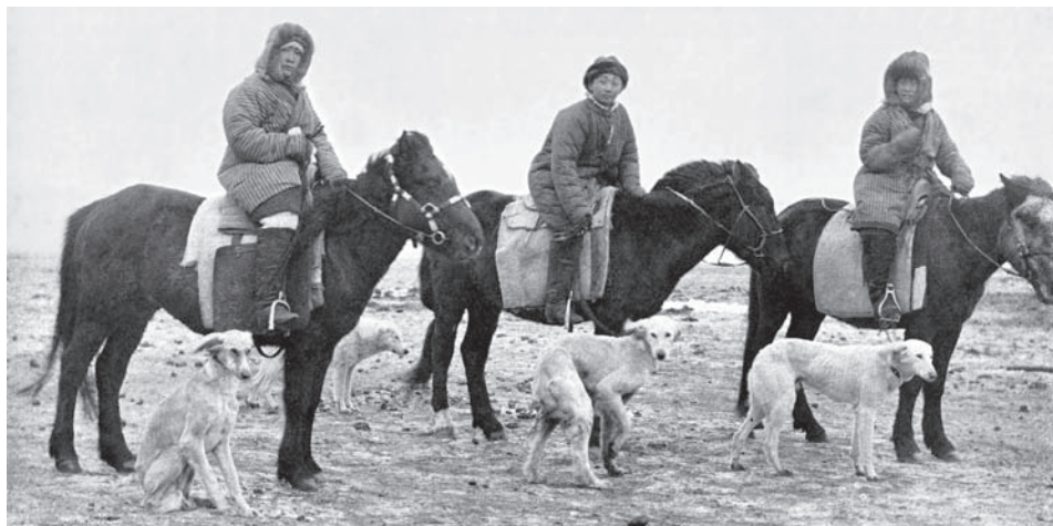
Рис. 5. Казахи. Акмолинская область. 1879 г.

***Данные С.И. Брука и В.М. Кабузана [1981, с. 24, табл. 4].