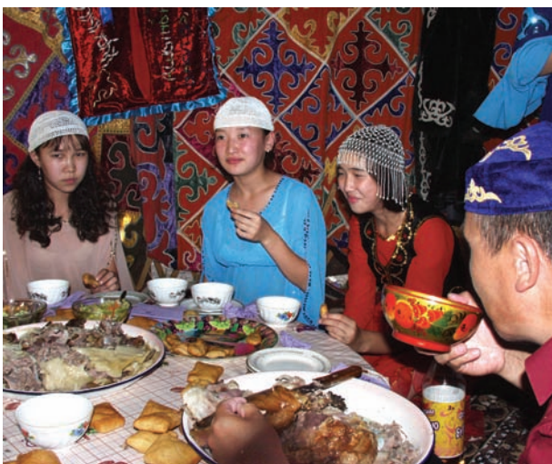
Рис. 14. В казахской юрте. 2006 г.