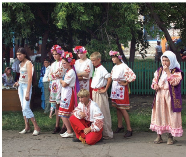
Рис. 16. Вместе. Омское Прииртышье. 2006 г.

ленных пунктах, в основном городского типа (следует напомнить, что все переписи послевоенного времени учитывали постоянное население). Через десять лет (в 1989 г.) данные переписи показали 15–28-кратное увеличение численности украинцев относительно 1970 г. – с 9 986 до 148 317 чел. в ХМАО и с 3 026 до 85 022 чел. в ЯНАО [Итоги..., 2005; Национальный состав..., 1981, 1990]. Подобные процессы характерны и для чувашей: в 1970 г. их было в этих округах соответственно 1 929 и 255 чел., а в 1989 г. – 14 000 и 3 657 чел. [Там же].