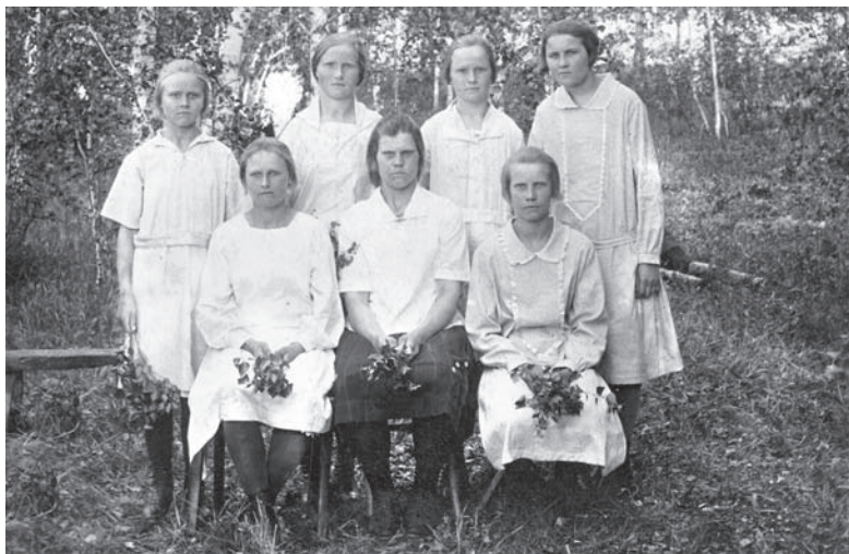
Рис. 10. Девушки-эстонки. Первая треть XX в.