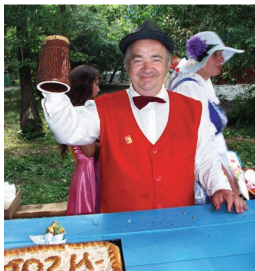
Рис. 12. Сибирские немцы. 2006 г.