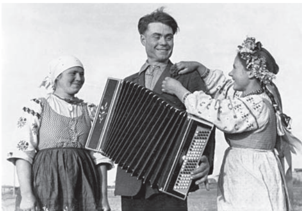
Рис. 8. Украинская молодежь. Прииртышье. 1930-е гг.