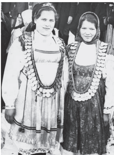
Рис. 9. Женщины в чувашской праздничной одежде. 1950-е гг.