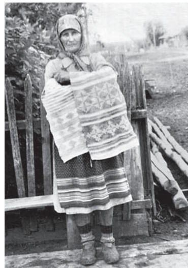
Рис. 7. Женщина в белорусской праздничной одежде. 1950-е гг.