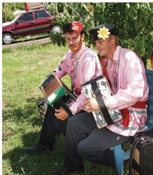
Рис. 11. Сибирские казаки. 2006 г.

В 1970–1990-х гг. на фоне масштабной трудовой миграции на порядки выросло население Ханты-Мансийского и Ямало-Ненецкого автономных округов Тюменской обл. в районах сырьевого освоения Тюменского Севера. Соответственно, возросла численность отдельных этнических групп. Так, например, прирост украинского населения в этих округах до начала 1970-х гг. – времени активного и масштабного нефтегазового «бума» – не выходил за рамки эволюционного развития, но уже перепись 1979 г. зафиксировала многократное его увеличение за счет трудовых мигрантов, оседавших во вновь создававшихся насе-