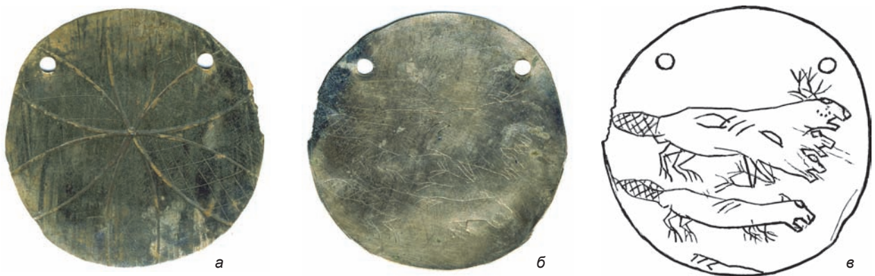
Рис. 8. Диск с изображением животных. а – обратная сторона; б – лицевая сторона; в – прорисовка изображений на лицевой стороне.

Данное изделие входит в группу бронзовых зеркал среднесарматской культуры конца II в. до н.э. – нача-