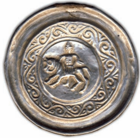
Рис. 7. Серебряная бляха с изображением всадника.

но-выставочный комплекс (МВК) им. Шемановского (г. Салехард). Н.В. Федорова относит перечисленные изделия к продукции ремесленных мастерских Волжской Болгарии XII–XIV вв. [2005].