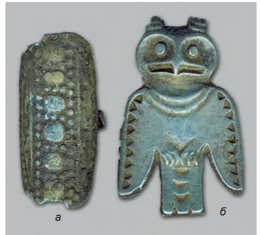
Рис. 4. Изделия из бронзы. а – перстень; б – фигурка филина.