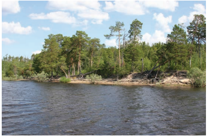
Рис. 2. Вид на городище Ус-нел.