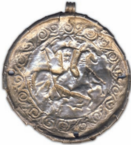
Рис. 6. Серебряная бляха с изображением всадника и поверженного воина.