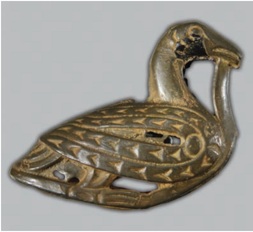
Рис. 1. Бронзовая фигурка птицы.