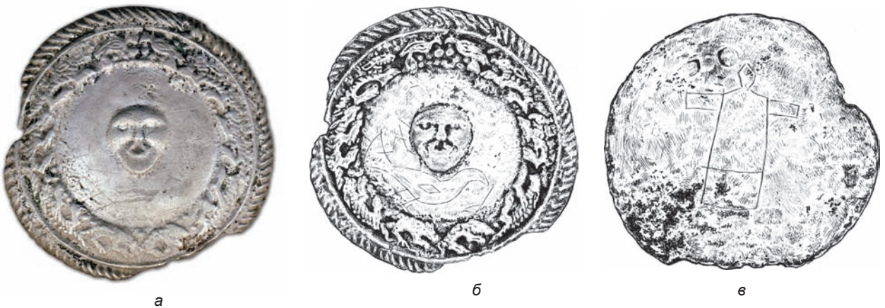
Рис. 5. Круглая бляха с личиной в окружении зверей и птиц. а – лицевая сторона; б – прорисовка изображений на лицевой стороне; в – прорисовка фигуры на оборотной стороне.