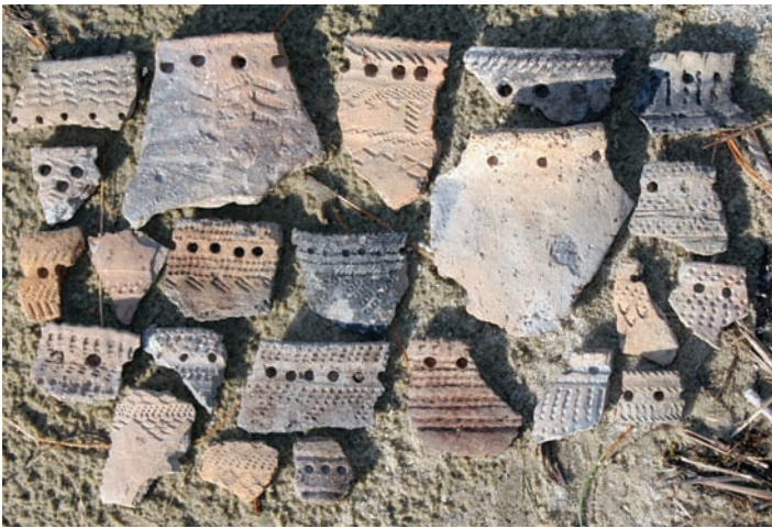
Рис. 3. Фрагменты керамики с городища.