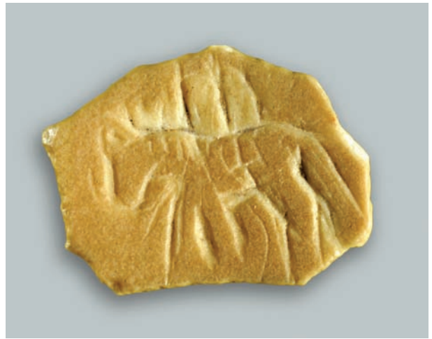
Рис. 1. Изображение всадника на фрагменте скорлупы страусового яйца (увеличено в 2 раза).

Изображения лошадей с зубчатыми гривами и всадников, сидящих к зрителю вполоборота, встре-