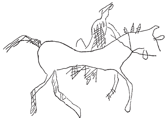
Рис. 3. Кыргызский всадник. Шишкинские писаницы (по: [Окладников, 1959]).

чены в петроглифах Монголии, в Бэгэр-сомоне Гоби-Алтайского аймака [Новгородова, 1984]. Необходимо отметить, что рядом с такими рисунками на скалах часто встречаются тамгообразные знаки в виде кру-