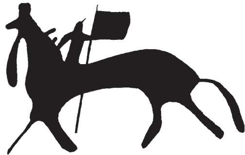
Рис. 2. Всадник с развернутым штандартом. Шишкинские писаницы (по: [Окладников, 1959]).