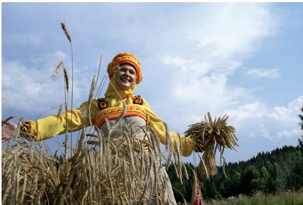
Участница Праздника Нового хлеба в архитектурно-этнографическом музее «Хохловка».

Коми-пермяки – народ с уходящими в глубокое прошлое традициями земледелия. Старшее поколение до сих пор хранит навыки жатвы: помнит, как управляться с серпом, вязать снопы. С началом и завершением жатвы связаны древние ритуалы; именно они легли в основу обрядового праздника Зажинки, проходившего в с. Архангельском Юсьвинского р-на Коми-Пермяцкого округа.