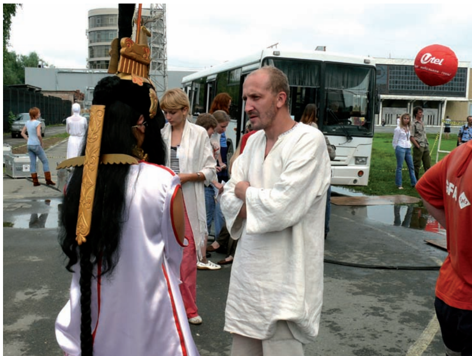
Один из рабочих моментов фестиваля.

Современный фолк, имея истоки в аутентичной музыкальной традиции, выходит за рамки этнической локальности и канона. Импровизация, заложенная в природу фольклора, служит основой для развития жанра, придавая музыке надэтнический характер.