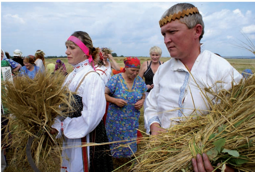
Ритуалы жатвы в дни фестиваля (г. Кудымкар).

Частью фестиваля стал конкурс национальной кухни «Чоскыт нянь» – «Вкусный хлеб». У коми-пермяков без хлеба, кваса и пива не обходится ни один праздник, ни одно застолье. Не важно, по какому делу вы зашли в коми-пермяцкий дом, – вам первым делом всегда предложат кружку с квасом. Квас готовят особым способом: зимой проращивают рожь с овсом и ставят «бражно» – закваску, на которой и «зреет» этот напиток.