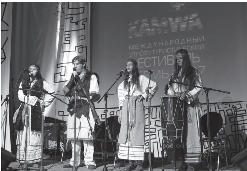
Выступление фолк-группы «Ведань Колодзь» из г. Красноярска.

Фольклорное искусство уникально: его архаичные формы воспринимаются как проявление авангарда, а за простотой звучания стоит огромный труд по освоению традиции. Ведущий российский фолк-музыкант и почетный гость фестиваля «Камва-2007» С.Н. Старостин рассказывал, что обучение игре на владимирском пастушьем рожке заняло у него пять лет.