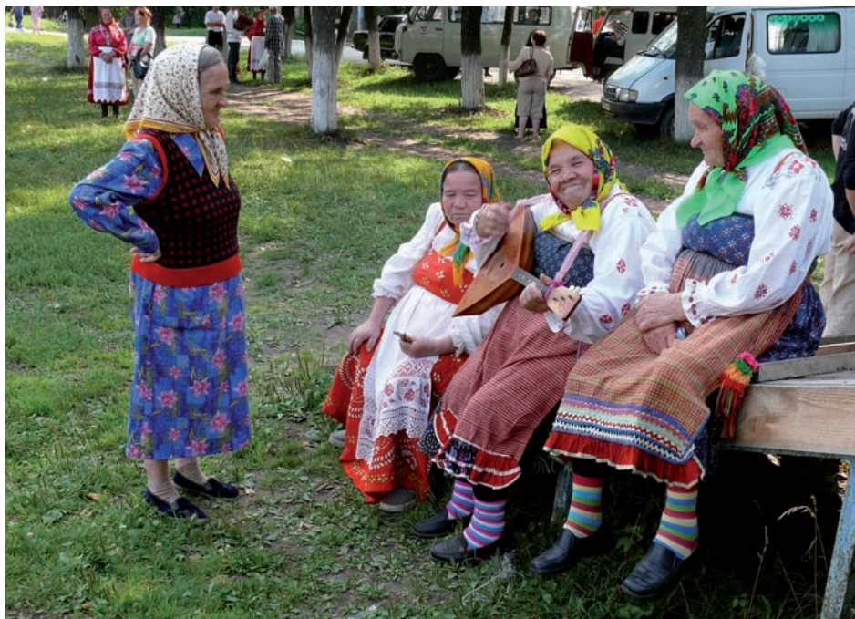
Участницы коми-пермяцкого фольклорного ансамбля.

Идеология этнофутуризма формирует символическое пространство фестиваля «Камва-2007». Новые образы соотносятся с аутентичной культурой и транслируются в унифицированную городскую среду. Для горожан Прикамья фестивальные практики становятся своеобразной формой освоения «этничности». Для жителей сел Коми-Пермяцкого округа этот праздник укладывается в культуру повседневности. Фольклорный ансамбль с. Коса – это бабушки, которые собрались вместе, достали из сундуков «печатные» набивные сарафаны-дубасы, холщовые белые рубахи и пестрядинные фартуки, взяли в руки старенькие балалайки и приехали в Пермь.