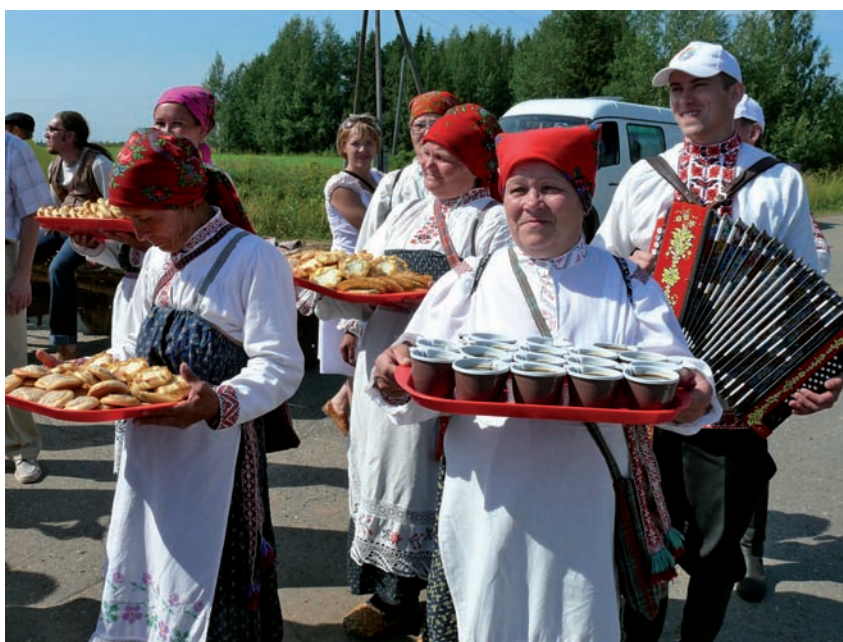
Встреча гостей и участников фестиваля «Камва-2007» в г. Кудымкаре – центре коми-пермяцкой земли. Хозяева праздника – фольклорный ансамбль из с. Кекур Кудымкарского р-на.

Архитектурно-этнографический музей «Хохловка» – один из крупнейших музеев деревянного зодчества на Урале. Идея его создания возникла в 1969 г., а открытие состоялось в 1980 г. Самая большая поляна музея – у церкви Преображения в с. Янидор (построена в 1704 г.) – стала местом главного фестивального хоровода. Участников праздника встречали фольклорные коллективы Пермского края, как и положено – пивом сур и коми-пермяцкими шаньгами.