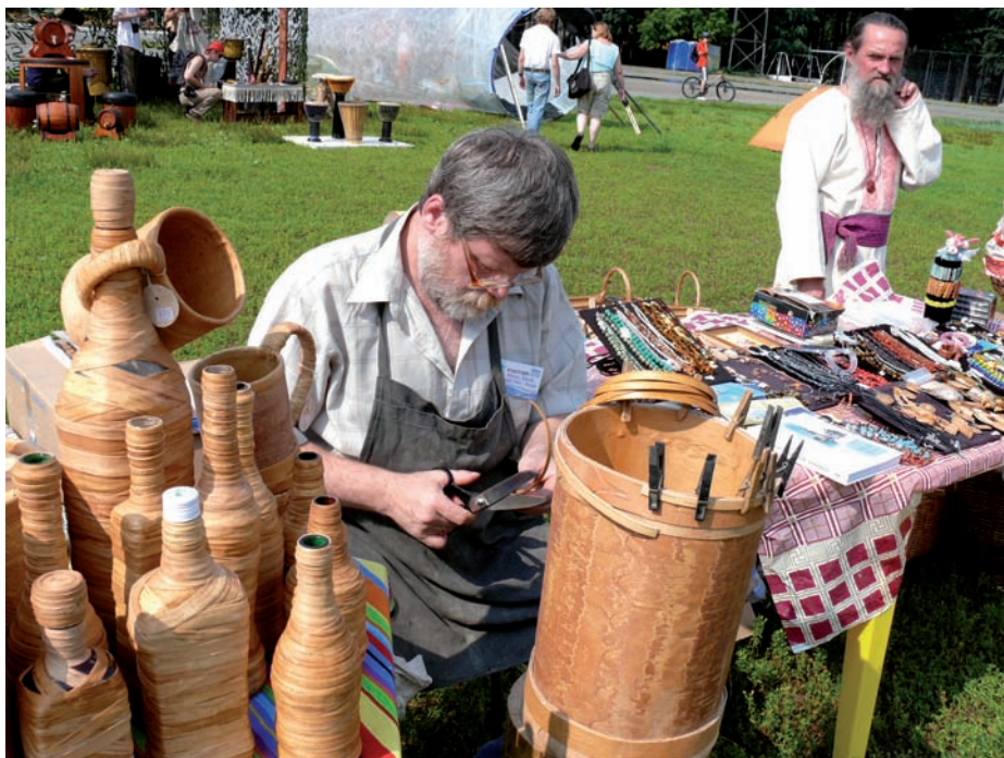
«Город мастеров» фестиваля «Камва-2007».

Этнофутуризм – эта стратегия возвращения в городскую среду этнических традиций. «Город мастеров» с презентацией народных ремесел занимает одну из самых больших площадок фестиваля. Пермские берестяники хранят секреты украшения утвари «чеканным» орнаментом; их посуда, оплетенная берестой, органично включается в интерьер крестьянской избы и современного дома. Традиционные украшения пермских ювелиров подчеркивают красоту старинных и авангардных нарядов.