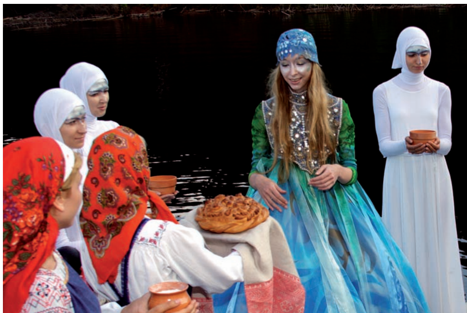
Встреча красавицы Камвы на берегу р. Камы.

Идеология этнофутуризма формирует символическое пространство фестиваля «Камва-2007». Новые образы соотносятся с аутентичной культурой и транслируются в унифицированную городскую среду. Для горожан Прикамья фестивальные практики становятся своеобразной формой освоения «этничности». Для жителей сел Коми-Пермяцкого округа этот праздник укладывается в культуру повседневности. Фольклорный ансамбль с. Коса – это бабушки, которые собрались вместе, достали из сундуков «печатные» набивные сарафаны-дубасы, холщовые белые рубахи и пестрядинные фартуки, взяли в руки старенькие балалайки и приехали в Пермь.