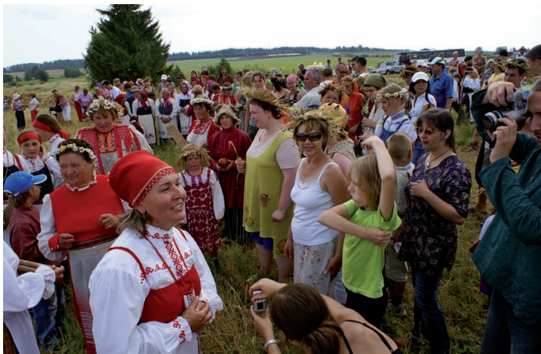
«Фестивальная поляна» на берегу р. Иньвы (г. Кудымкар).

Коми-пермяки – народ с уходящими в глубокое прошлое традициями земледелия. Старшее поколение до сих пор хранит навыки жатвы: помнит, как управляться с серпом, вязать снопы. С началом и завершением жатвы связаны древние ритуалы; именно они легли в основу обрядового праздника Зажинки, проходившего в с. Архангельском Юсьвинского р-на Коми-Пермяцкого округа.