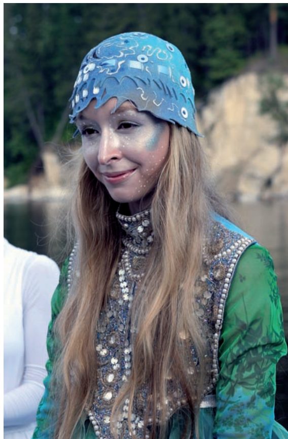
Камва – лицо и символ Международного этнофутуристического фестиваля.

В августе 2006 г. во вновь образованном Пермском крае состоялся I Международный этнофутуристический фестиваль «Камва». Камва – обобщенный образ великой р. Камы; это имя – новация, образованная на основе финно-угорского гидронима «ва» («вода», «река»). В 2007 г. фестиваль проводили во второй раз. С этого момента «Камва» приобрела статус постоянно действующего Международного этнофутуристического фестиваля.