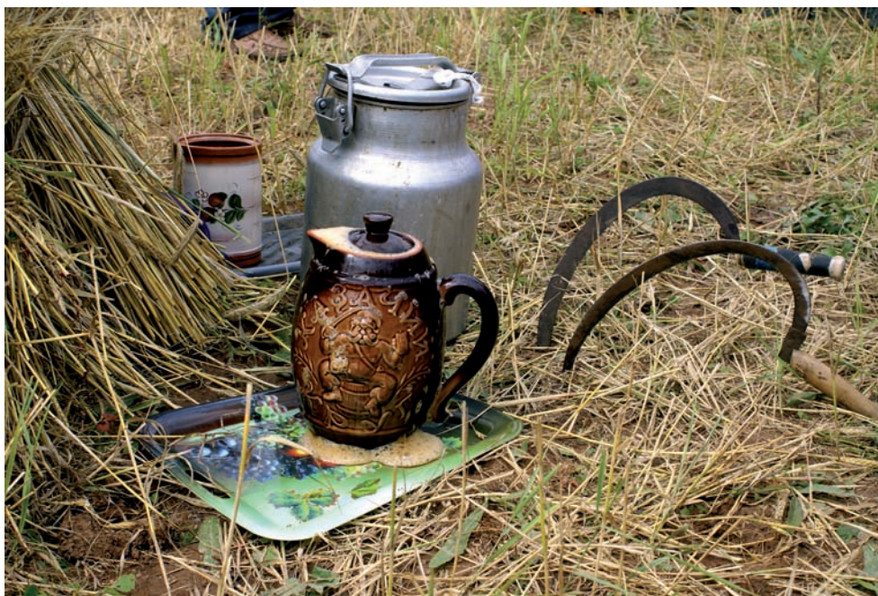
Угощение к ритуалу жатвы.

Частью фестиваля стал конкурс национальной кухни «Чоскыт нянь» – «Вкусный хлеб». У коми-пермяков без хлеба, кваса и пива не обходится ни один праздник, ни одно застолье. Не важно, по какому делу вы зашли в коми-пермяцкий дом, – вам первым делом всегда предложат кружку с квасом. Квас готовят особым способом: зимой проращивают рожь с овсом и ставят «бражно» – закваску, на которой и «зреет» этот напиток.