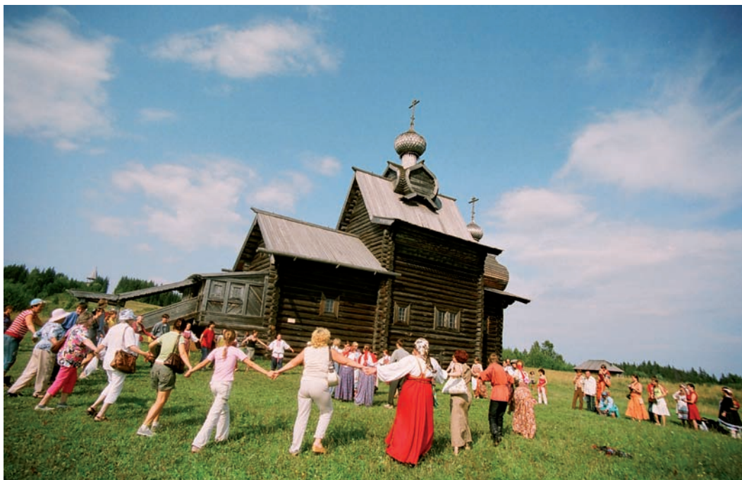
Архитектурно-этнографический музей «Хохловка», одна из площадок фестиваля «Камва-2007».

Архитектурно-этнографический музей «Хохловка» – один из крупнейших музеев деревянного зодчества на Урале. Идея его создания возникла в 1969 г., а открытие состоялось в 1980 г. Самая большая поляна музея – у церкви Преображения в с. Янидор (построена в 1704 г.) – стала местом главного фестивального хоровода. Участников праздника встречали фольклорные коллективы Пермского края, как и положено – пивом сур и коми-пермяцкими шаньгами.