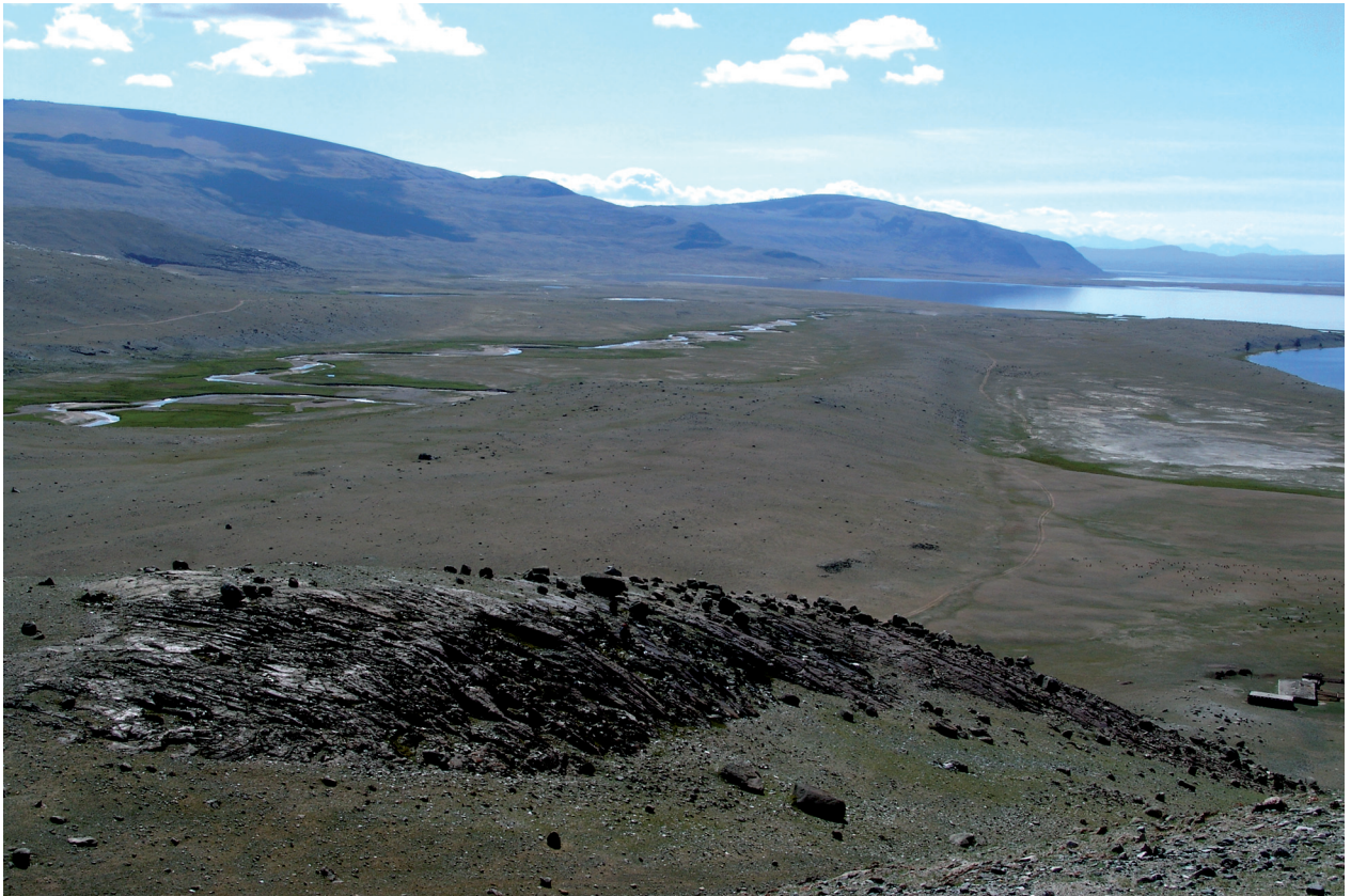
Рис. 2. Вид на пункт с петроглифами Билуут-Толгой-2 с запада.