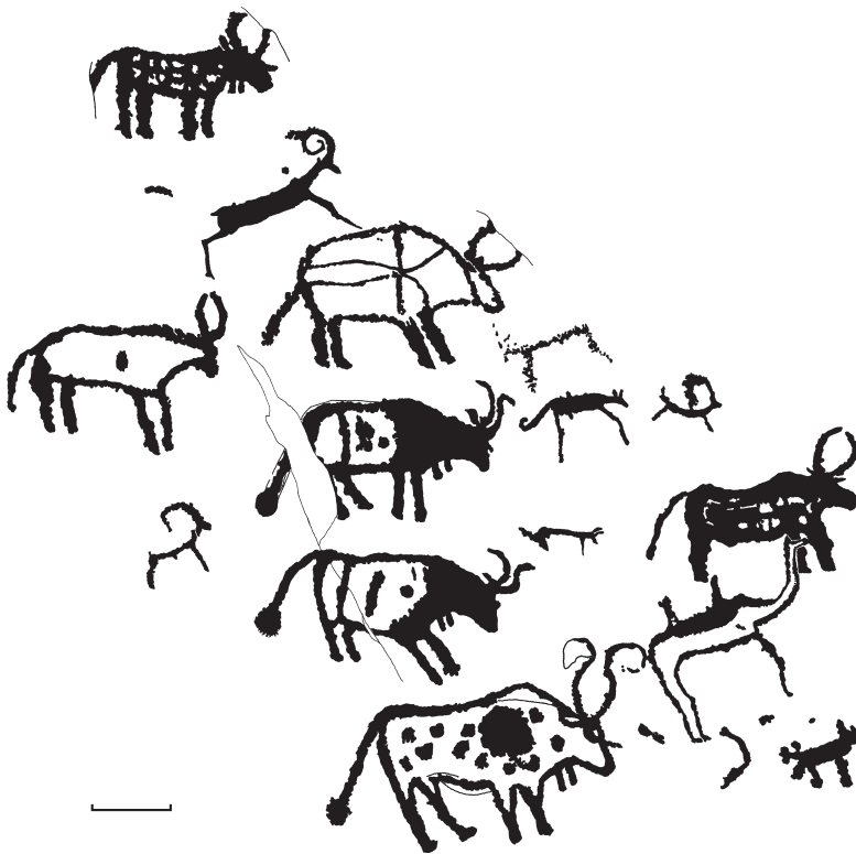
Рис. 3. Композиция с быками и другими животными. Эпоха ранней бронзы.

значены как самостоятельные пункты – Билуут-Толгой-1–3. Памятник открыт монгольским археологом Х. Едилханом, а первые сведения о нем были указаны в лаконичном сообщении об исследованиях Монгольско-американско-казахской экспедиции в 2004 г. [Kortum et al., 2005].