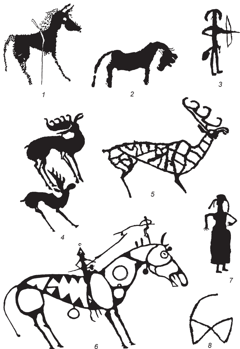
Рис. 7. Образы и сюжеты петроглифов Билуут-Толгоя.

Одни лошади запечатлены в достаточно реалистичной манере, грациозными. У них длинные и ноги, и шея, маленькая голова. Другие – с коротким туловищем и короткими толстыми ногами, короткой шеей и большой головой, наклоненной вниз. Фигуры лошадей первого типа в Билуут-Толгое присутствуют рядом с изображениями быков и колесниц (ранняя и развитая бронза). Фигуры лошадей второго типа (рис. 7, 1, 2) датируются, вероятно, поздней бронзой (андоновская или карасукская эпоха) и по стилистическим особенностям соответствуют образу коня, воплощенному в петроглифах Казахстана [Самашев, Курманкулов, Жетыбаев, 2000, рис. 2–4].