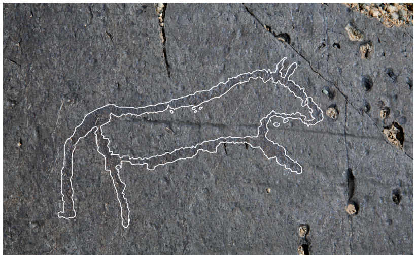
Рис. 6. Изображение лошади эпохи ранней бронзы.