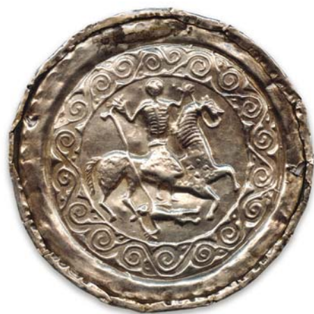
Рис. 5. Бляха с изображением всадника и поверженного воина.