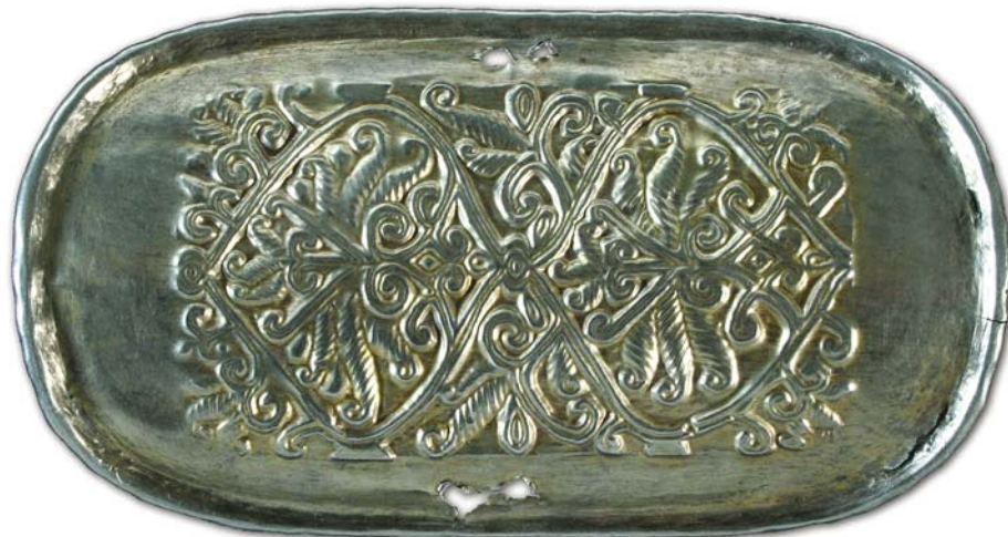
Рис. 1. Щиток с растительным орнаментом.