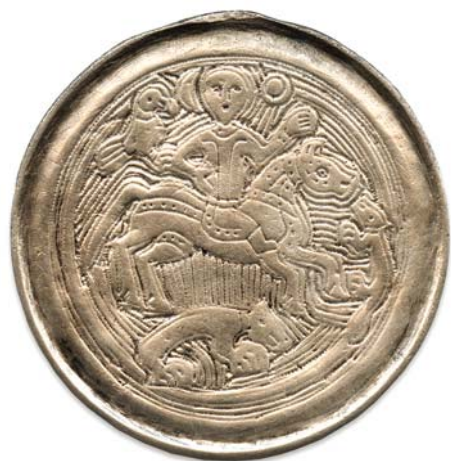
Рис. 7. Бляха со сценой охоты.