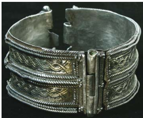
Рис. 4. Двустворчатый браслет.