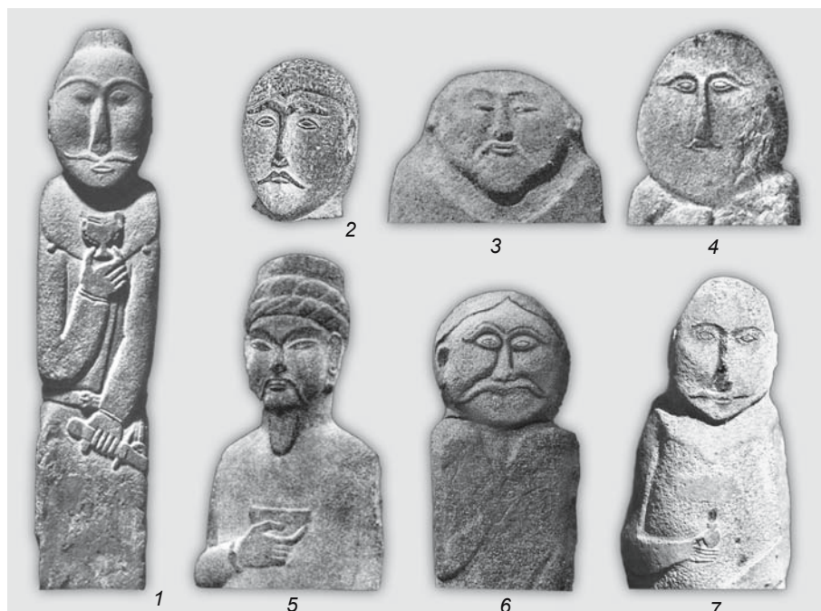
Рис. 1. Изображения черт лица на реалистичных древнетюркских изваяниях Семиречья (1–6) и Тувы (7).

1 – по: [Федоров-Давыдов, 1976]; 2 – по: [Чариков, 1980]; 3–5 – по: [Шер, 1966]; 6 – по: [Маргулан, 2003]; 7 – по: [Грач, 1961].