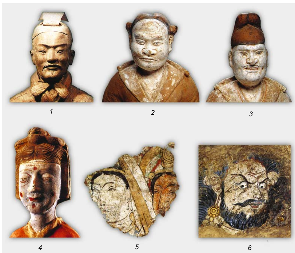
Рис. 8. Изображения лиц с Т-образными надбровьями и носом (1–5), искаженных гримасой гнева (6). 1–4 – Китай (по: [China..., 1994; Excavation..., 2004]); 5, 6 – Восточный Туркестан (по: [Дьяконова, 1995]).

но тщательно (без изображения век, зрачков и других деталей). Так нельзя ли предположить (вполне в русле гипотезы о раскрашивании древних изваяний), что у менее искусно выполненных древнетюркских скульптур эти детали лица (веки, зрачки глаз, брови) дополнительно раскрашивались? Так же, как это делалось, например, с недостающими деталями при изображении прически, одежды, пояса и т.д.* Подобный прием (рельефное глазное яблоко с показанными на нем веками и зрачком) известен в китайской корoplastике (см. рис. 8, 1–4).