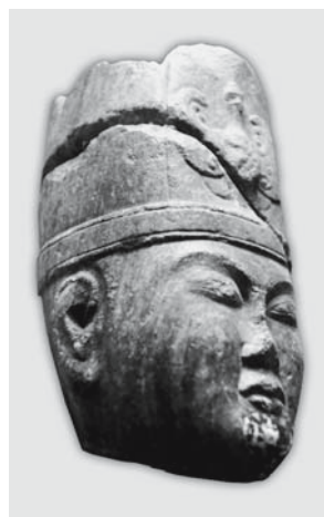
Рис. 6. Голова скульптурного изображения Кюль-тегина. Монголия.