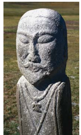
Рис. 7. Изваяние “Даян-батыр”. Монголия.