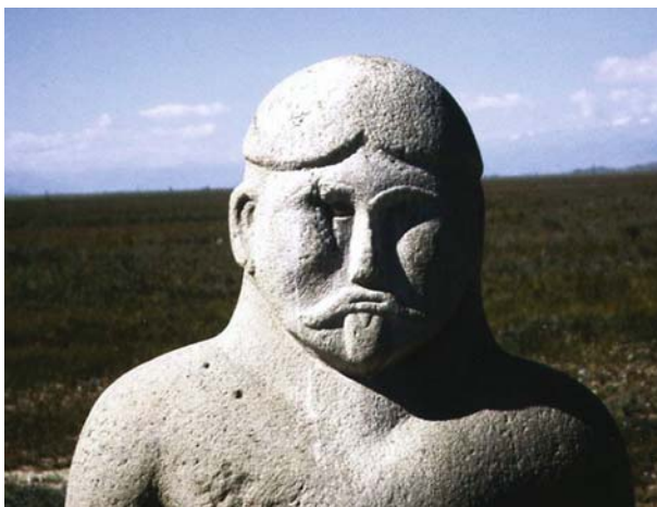
Рис. 5. Голова древнетюркского изваяния “Чингисхан”. Барлыкская степь. Тува.

Конечно, среди общего числа древнетюркских изваяний Центральной и Средней Азии подавляющее большинство составляют достаточно схематичные и даже примитивные. Однако объяснение этому, по-видимому, нужно искать в социально-имущественном положении рядовых членов древнетюркского общества – воинов или гражданских лиц других сословий (невозможность нанять профессионального каменотеса-скульптора,