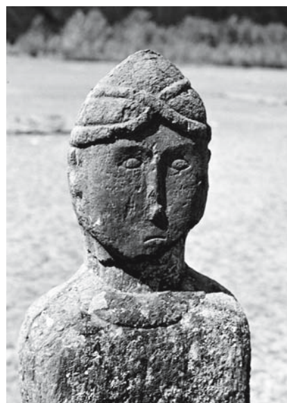
Рис. 3. Изваяние из местности Кеме-Кечу, Алтай.