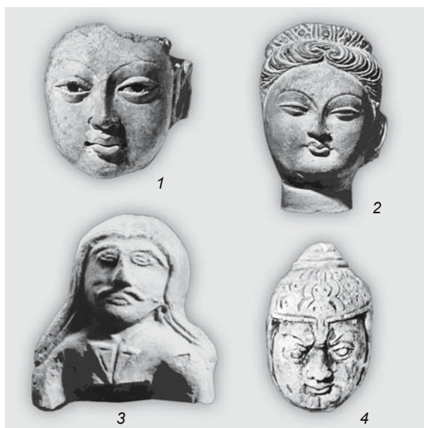
Рис. 9. Изображения лиц с Т-образными надбровьями и носом (1–3), искаженных гримасой гнева (4). 1, 2, 4 – Восточный Туркестан (по: [Дьяконова, 1995]); 3 – Приаралье (по: [Рапопорт, Неразик, Левина, 2000]).