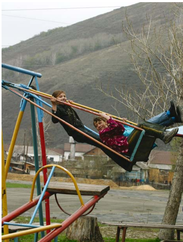
12. Р. Салихов. К началу мая, когда сходит последний снег, оживают качели. Село Солонешное.

В постсоветской России уже не празднуют День международной солидарности трудящихся. Изменился праздник 1 Мая, став праздником труда; но не изменилось ощущение радости, связанное с приходом весны и пробуждением жизни.