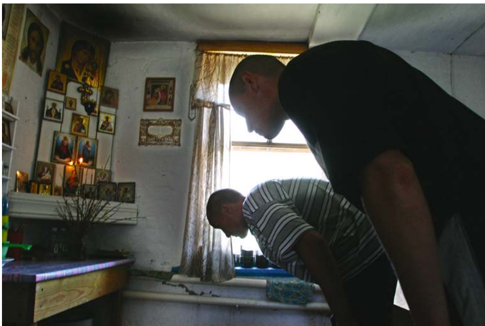
13. Р. Салихов. Вера дает надежду на возвращение к жизни. Реабилитационный центр “Асклепион” в селе Топольном.

В русской культуре священные истины православия обрели житейские смыслы. Образ Светлой Пасхи – воскрешения, “смертью смерть поправшего”, определил личную перспективу для тех, кто ищет спасения от болей и бед в земном мире.