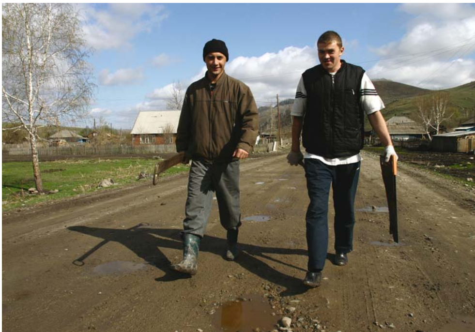
14. Р. Салихов. Весна начинается со стройки. С наступлением мая в селах звенят пилы. Село Топольное.

В русской культуре священные истины православия обрели житейские смыслы. Образ Светлой Пасхи – воскрешения, “смертью смерть поправшего”, определил личную перспективу для тех, кто ищет спасения от болей и бед в земном мире.