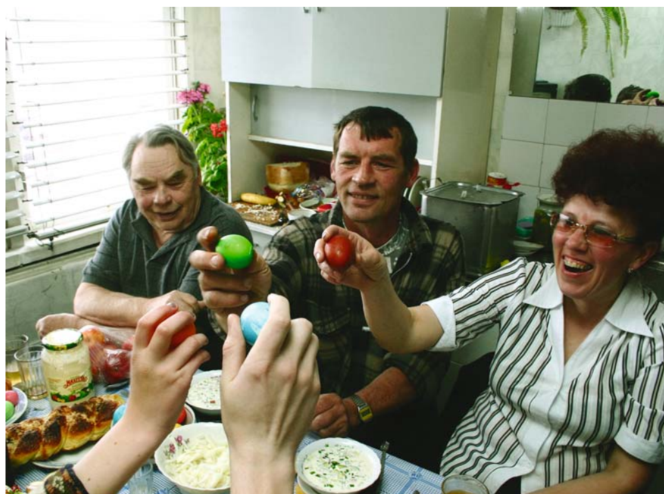
4. М. Шипенков. Пасха. Село Солонешное.

В 2005 г. майские праздники в России совпали с пасхальной неделей. Но не было в селах Солонешенского района Алтайского края ни кумачовых транспарантов, ни колокольного звона. Советские традиции ушли, а православные остались привязанными к семейному кругу.