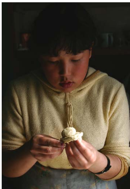
6. Р. Салихов. В доме Тукешевых пекут пасхальную сдобу. Село Каракол.

Весна дает надежду на обновление мира. Накануне православной Пасхи душу освобождают от грехов, а дома отмывают от копоти и грязи: “Чтобы Боженька мог без страха через порог перешагнуть” – так говорят старушки, заставляя внуков перемывать полы.