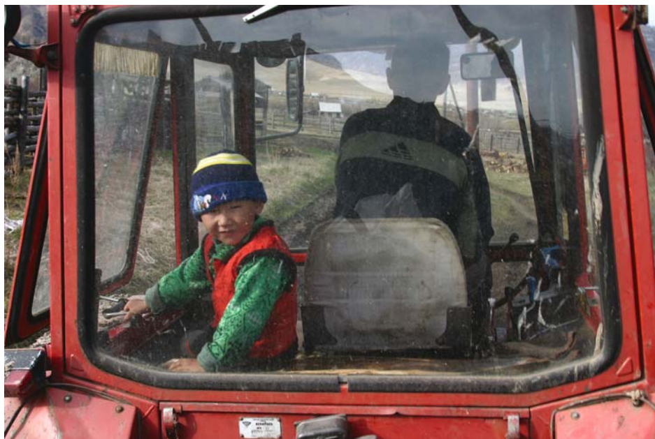
2. Р. Салихов. На маральнике села Каракол начинается рабочий день.

Май пришел на Алтай с прозрачной зеленью лесных околков, внезапными снежными зарядами, бурным разливом рек и ручьев, с горьковатым дымом костров, на которых горел мусор долгой зимы, с огородными работами и традиционным сахманом: на животноводческих фермах по долинам Ануя и его притоков начался окот – и забыли сельчане о выходных и праздниках.