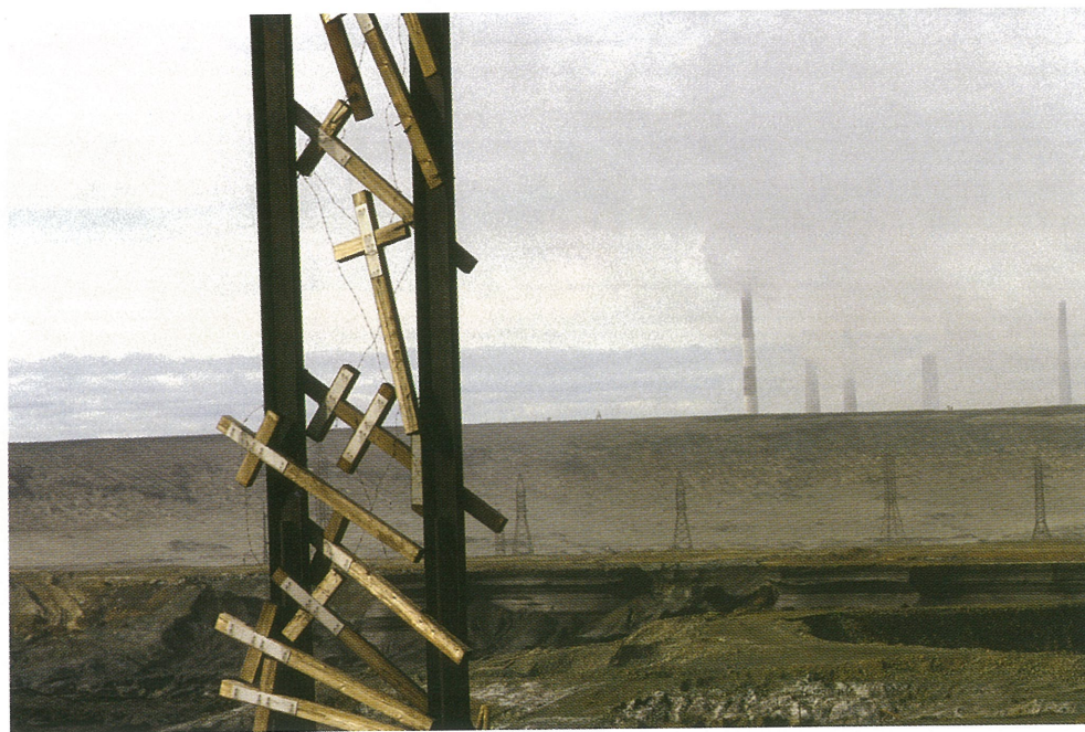
15. Хайди Брэднер. Памятник жертвам Норильсклага – полякам, погибшим при строительстве промышленных гигантов г. Норильска.