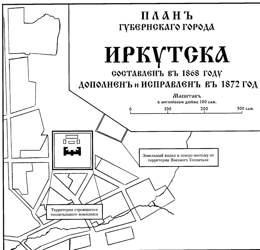
Рис. 3. Фрагмент плана г. Иркутска за 1872 г. (ОРК НБ ИГУ, № 6393 (12)).