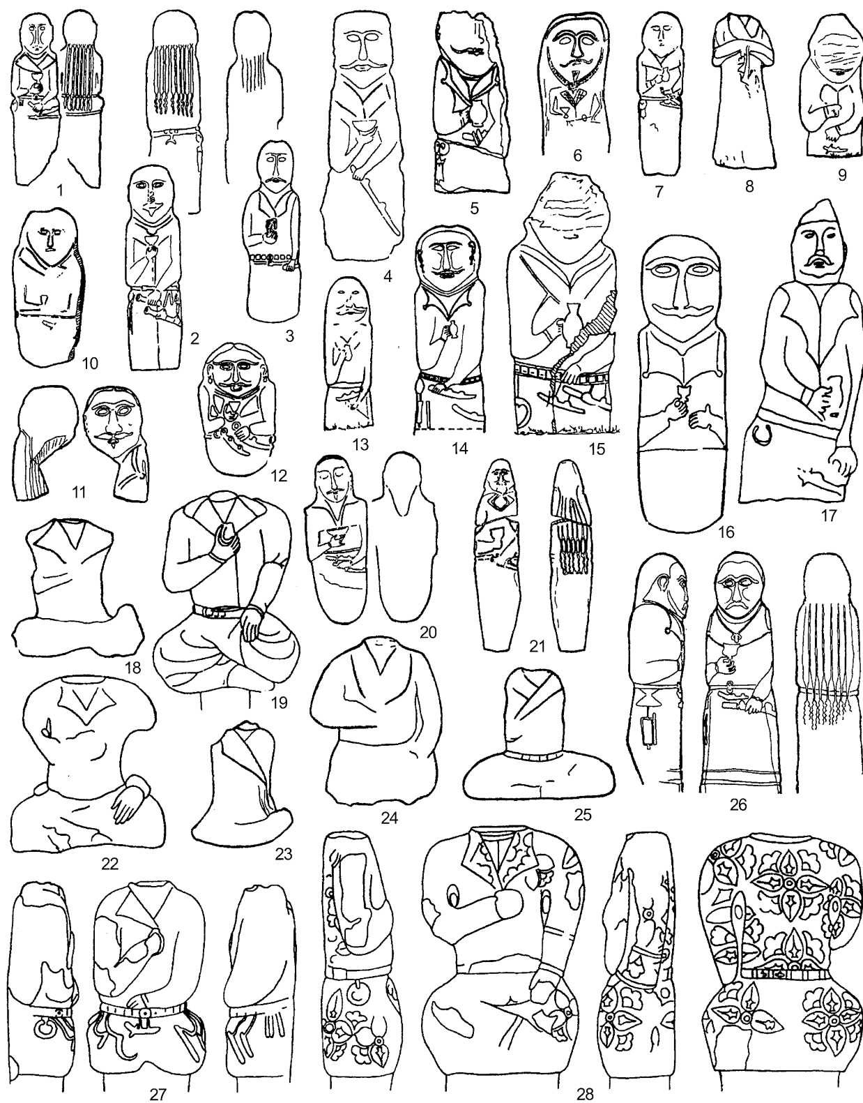
Рис. 1. Изображения деталей одежды на древнетюркских изваяниях.

1 – 4, 6, 7, 10 – 12, 16, 20, 21, 26 – Казахстан; 5, 9, 13 – 15 – Алтай;