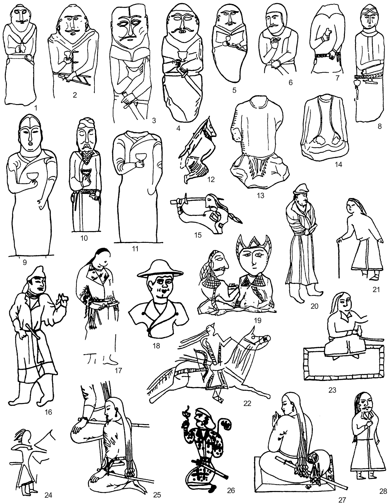
Рис. 3. Изображения деталей одежды на изваяниях, граффити и настенных росписях. 1, 8, 12, 22, 24 – Алтай; 2, 3, 13, 14 – Тыва; 4, 5, 15, 19 – Семиречье; 6, 7, 9 – 11, 21, 23, 28 – Монголия; 16, 18 – Китай; 17, 25, 27 – Афрасиаб; 20 – Япония; 26 – Гиндукуш.