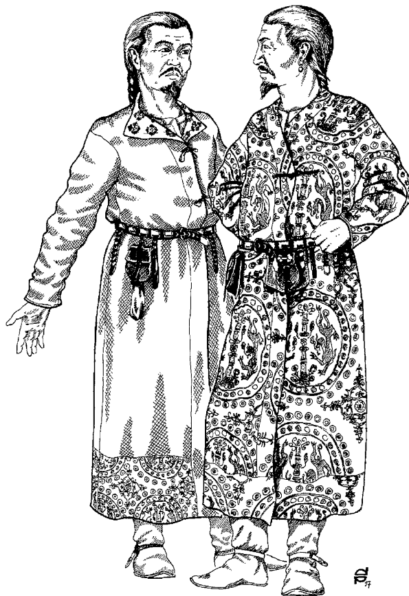
Рис. 4. Два варианта халата древних тюрков.

В целом необходимо отметить относительную “этническую однородность” древнетюркских изваяний на территории Российского и Монгольского Алтая и Тывы, имеются в виду каноническая поза изображенных людей и реалии на них, в том числе халаты двух рассмотренных вариантов. Каменные скульптуры Центральной Монголии отличаются значительным своеобразием. Разнообразие деталей одежды, предметов и т.п. на изваяниях Семиречья, по-видимому, отражает сложные этнические процессы, которые происходили в этом регионе.