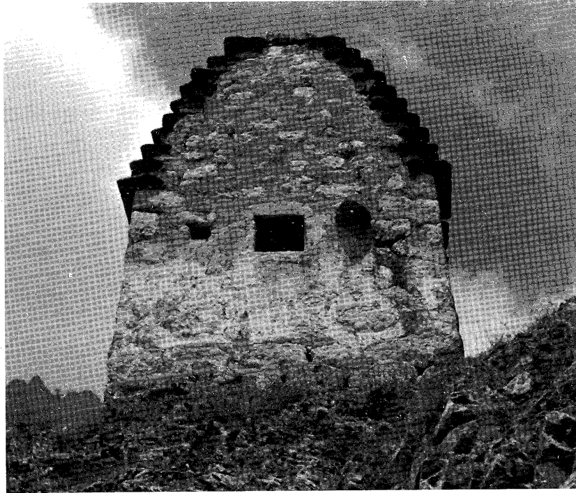
Рис. 3. Осетинский склеп с имитацией жернова у входа. Северная Осетия.