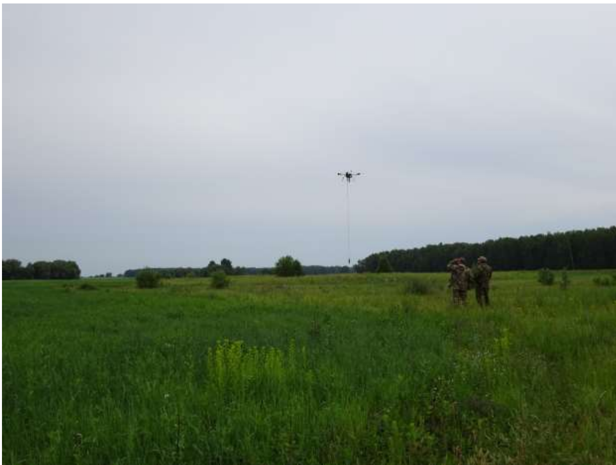
Процесс исследований на городище Преображенка-2 (Чановский район НСО). Опыт работы на рельефно выраженных памятниках.

лесостепи (Тартас-1, Яшкино-1, Преображенка-2, Погорелка-2, Сергино-1, Аул-Кошкуль-1, Белая Грива). Сейчас предстоит длительный этап обработки данных. Мы ожидаем интересных результатов.