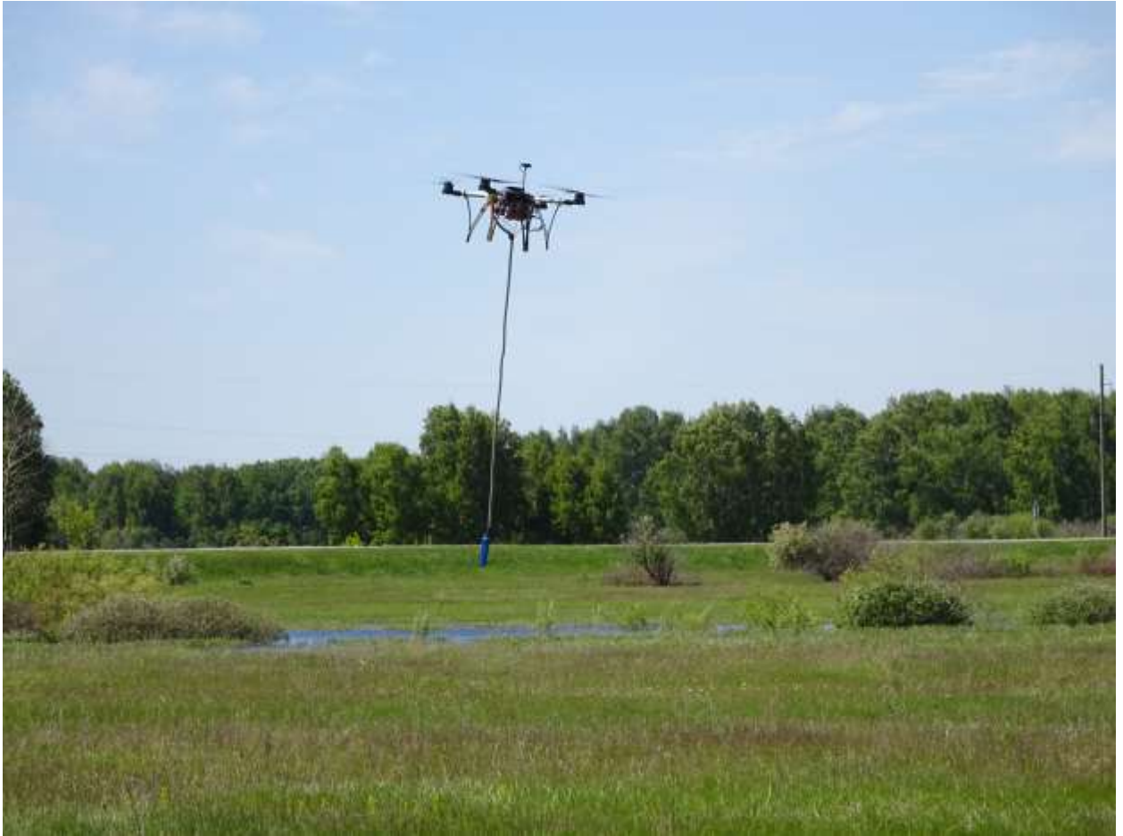
Разновременный могильник Тартас-1.

Сотрудники Института археологии и этнографии и Института геологии и геофизики СО РАН провели испытания новой разработки геофизиков с использованием беспилотной авиации, закрепив высокочастотный магнитометр на квадрокоптере.