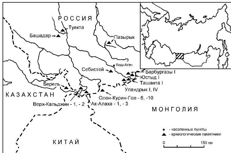
Рис. 1. Схема расположения могильников пазырыкской культуры, из которых происходит исследованная древесина.

В данную выборку памятников вошли все основные категории курганов пазырыкской культуры: 1) курганы высшей (племенной) элиты; 2) курганы средней (родовой) знати; 3) курганы рядового населения. Для полноты картины образцы на каждом памятнике по возможности отбирались в максимальном количестве и от разных конструктивных элементов деревянного погребального сооружения.