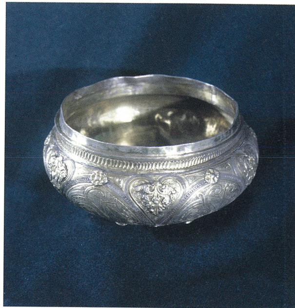
Рис. 3. Западноевропейская чаша из Нижнего Приобья.