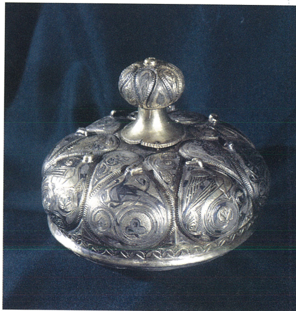
Рис. 5. Крышка с “яблоком” от западноевропейской чаши из Нижнего Приобья.

машине будут обеспечены на многие дни”, и украдкой взял ее”. Далее следует сентиментальный рассказ о щедром короле, который не только оставил бедному рыцарю крышку, но и отдал чашу [Сокровища Приобья, 1996, с. 25]. Для понимания ситуации важно обратить внимание на оговорку о том, что домашних можно обеспечить “на многие дни”, похитив только