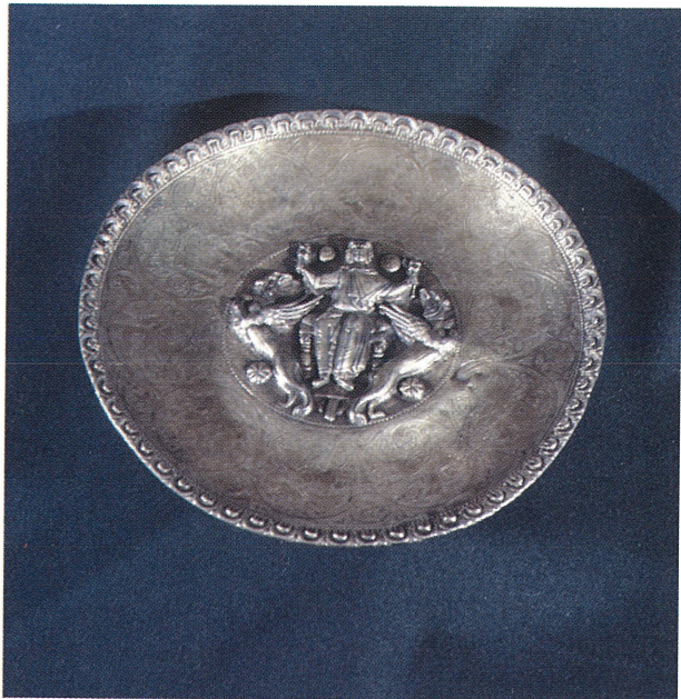
Рис. 2. Византийская серебряная чаша с изображением вознесения Александра Македонского.