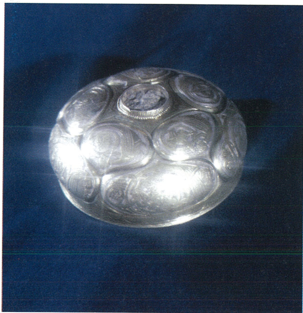
Рис. 4. Крышка от западноевропейской чаши из Нижнего Приобья.