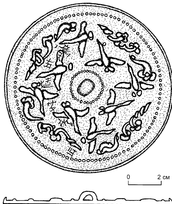
Рис. 2. Зеркало П-96-5.

Зеркало П-96-5 круглое, в диаметре 10,6 см (рис. 2). В центре расположена высокая несколько приплюснутая шишка-держатель, вокруг которой имеется расчлененный рельефный круг. Такое же обрамление проходит вокруг высокого тонкого и закругленного во внутрь бортика. На поле между кругами изображены четыре пары гусей, парящих под облаками. Малый круг и держатель символизируют землю, а строй летящих вокруг птиц, напоминающий квадрат, и облака олицетворяют четыре стороны света. Зеркала с аналогичным расположением рисунков найдены в Приморье [Шавкунов, Конькова, Хорев, 1987, с. 88 – 89, рис. 8; Шавкунов, 1988, с. 65 – 67, рис. 3]. В стилизованных облаках угадываются фантастические грибы чжи – символы даосского долголетия и бессмертия. Из литературы известно, что гуси на Дальнем Востоке являются символом ян – активного начала в природе. Согласно поверью, они всегда летают парами и символизируют верность в браке. Это зеркало мож-