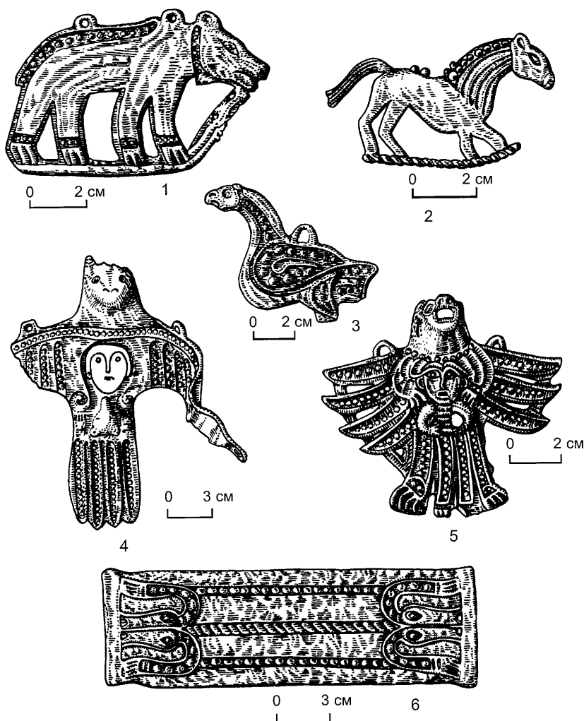
Рис. 2. Образцы торовтики с кантами.

1 – могильник Тимирязевский II; 2 – могильник Релка; 3 – Липкинский могильник; 4 – могильник Окунево; 5 – Васюганский клад; 6 – могильник Аксеново.