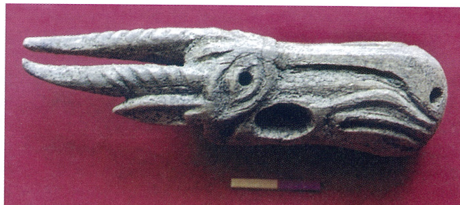
Рис. 3. Роговая бляшка с изображением головы сайгака из могильника Тянгис-Тыт. Вид слева.