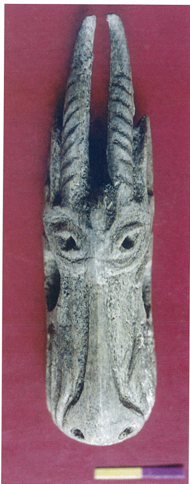
Рис. 4. Роговая бляшка с изображением головы сайгака из могильника Тянгис-Тыт. Анфас.