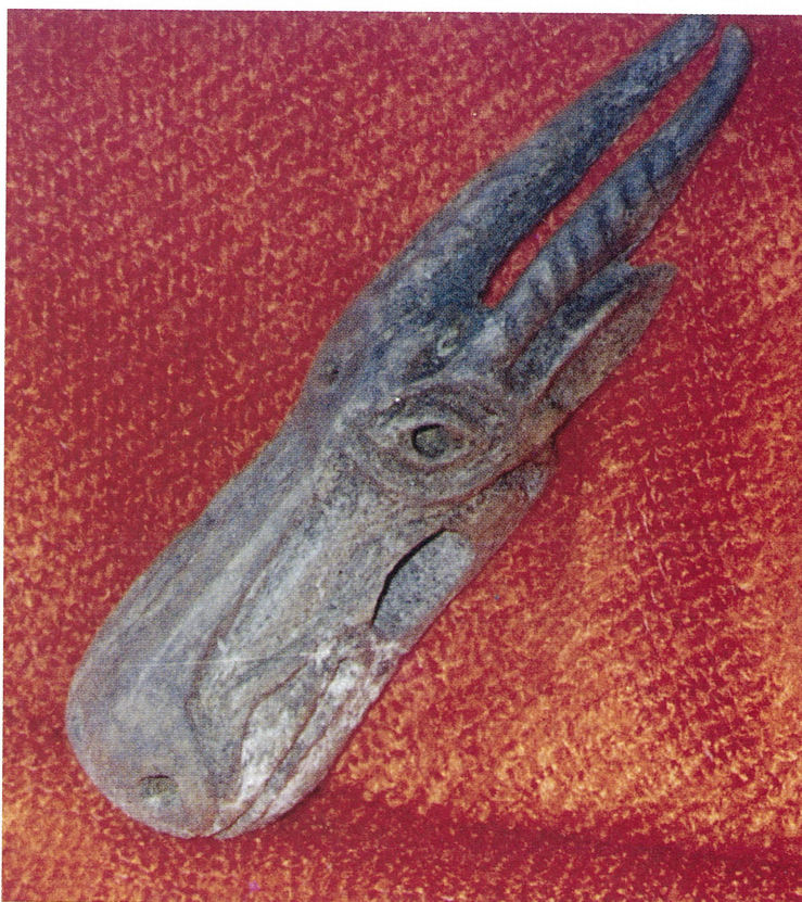
Рис. 5. Роговая бляшка с изображением головы сайгака из могильника Тянгис-Тыт. Вид справа.