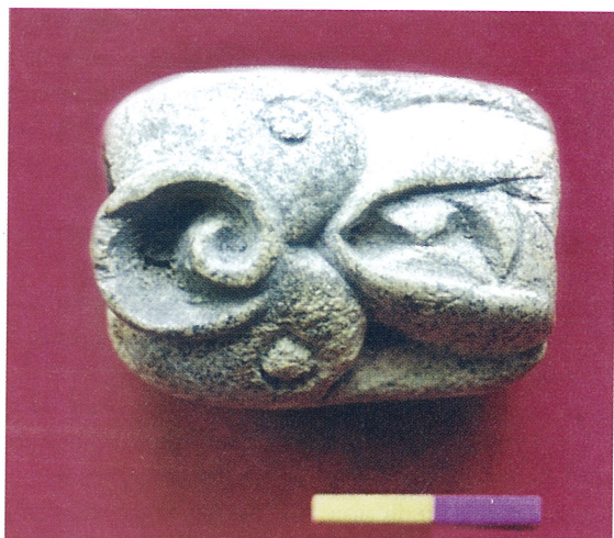
Рис. 2. Роговая пронизь с изображением головы барса из могильника Кок-Эдиган.