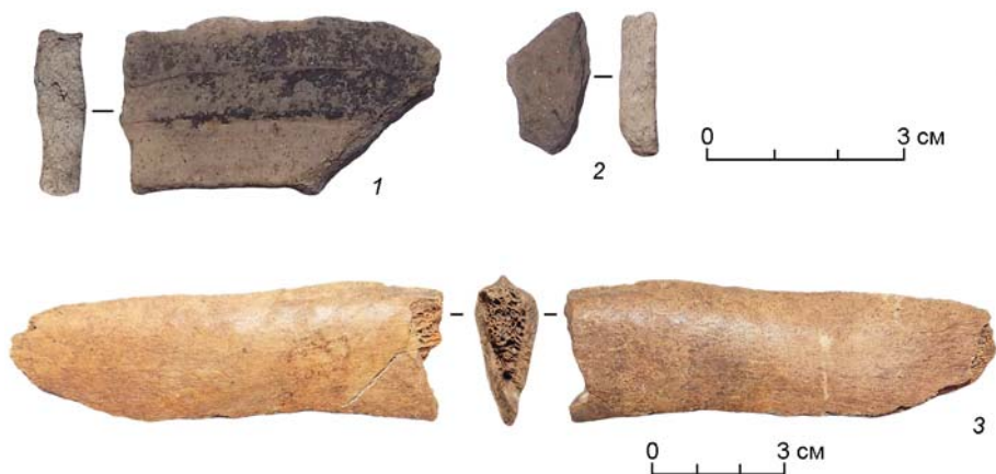
Рис. 2. Артефакты, обнаруженные в ходе зачистки берегового обнажения. 1, 2 – фрагменты русской лепной керамики, обработанной на гончарном круге; 3 – кость животного.

Исследования поселенческого комплекса в урочище Захар-Дуброво продолжены в 2022 г. В ходе визуального осмотра территории памятника были обнаружены еще четыре западины от жилищ. Зачистка береговых обнажений дала нам представления о стратиграфии поселения (с учетом нарушения целостности культуросодержащего слоя «черными копателями»). Обнаружены фрагменты керамики и кости животных. (рис. 2, 1–3).