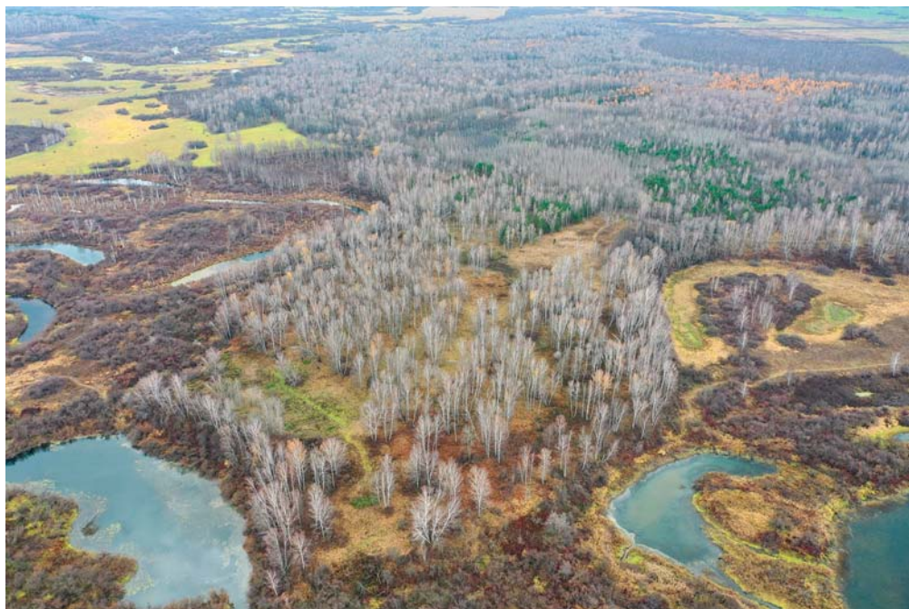
Рис. 1. Общий вид мысовидного участка урочища Захар-Дуброво с выявленным русским поселением XVIII в.