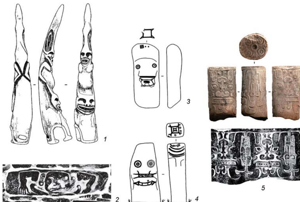
Рис. 3. Сравнение искусства окуневской культуры и культуры Шимао.

1, 4, 6 – окуневская культура; 2, 3, 5, 7 – культура поздней шицзяхэ; 1, 4, 6 – камень; 2, 3, 5, 7 – нефрит; 1, 4, 6 – по: [Вадецкая, Леонтьев, Максименков, 1980]; 2, 3, 5 – по: [Шицзяхэ..., 2008]; 7 – по: [Чжан Яфэн, Чжоу Хуа, 2020].